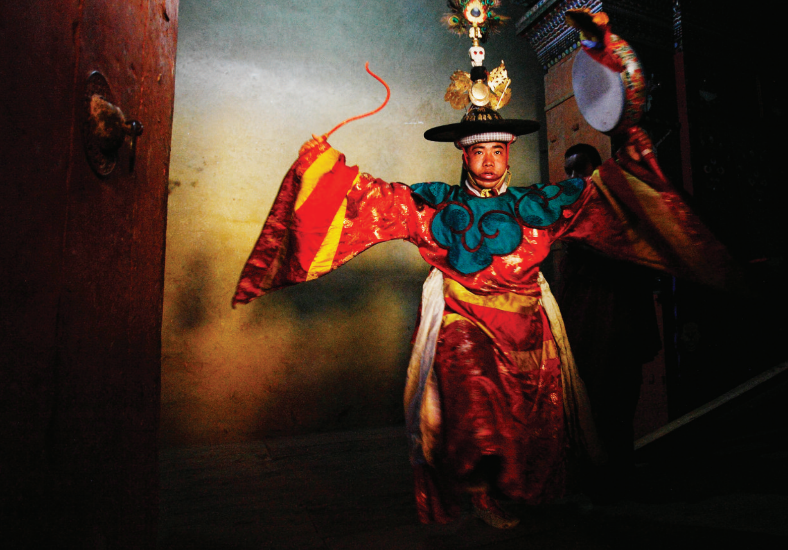
📍 Maskitants Bhutani Drametse küla pidustustel.