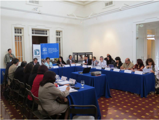
Reunión de Organismos y Mecanismos especializados en Cultura de la CELAC