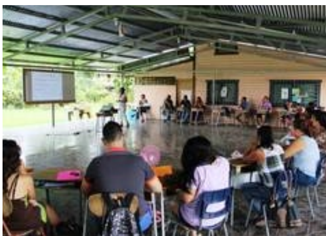
© UNESCO/SJO Palmar Sur, Costa Rica