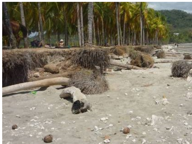
La erosión costera es uno de los problemas asociados al cambio climático por los especialistas de la UCR