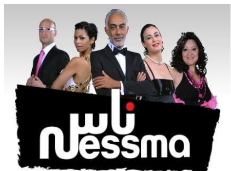
Affiche de l'émission Ness Nessma , sur Nessma TV

Un talk-show est un débat télévisé qui rassemble un nombre de personnes (politiciens, artistes ou experts) pour discuter de différents sujets proposés par l'animateur. Des fois, un seul invité est présent sur le plateau pour présenter son travail ou sa création. Le talk-show renvoie à une ambiance