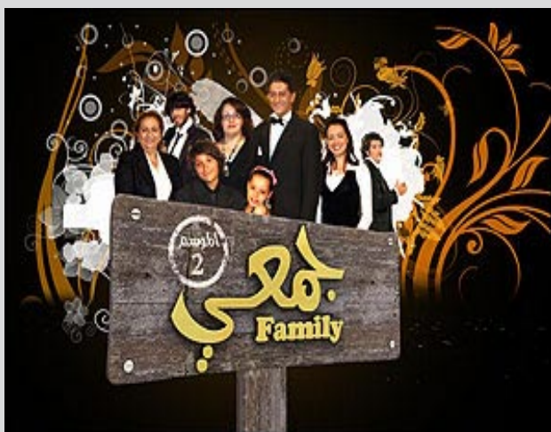
Affiche de la sitcom algérienne Djemai Family , diffusée sur ENTV. Réalisateur : Djaafar Gacem

Nous sommes ici face à une situation qui nous informe que la voix de la femme n'est pas entendue et n'a aucun poids. Pour faire face à l'homme, la femme doit agir comme lui et l'imiter, utiliser ses expressions et adopter ses attitudes. Un stéréotype pour résoudre un conflit.