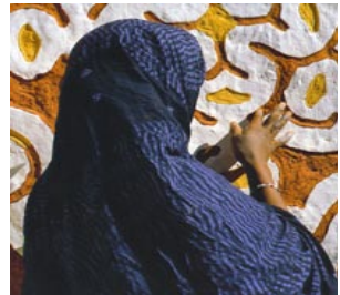
Affiche du documentaire En attendant les hommes (2007), Réalisatrice : Katy Lena Ndiaye

Katy Lena Ndiaye a réalisé en Mauritanie, en 2007, un film documentaire intitulé « En attendant les hommes ». L'histoire tourne autour de trois femmes mauritaniennes qui vivent à Oualata, la ville rouge à l'extrême Est du désert mauritanien où la plupart des hommes sont partis chercher fortune dans les grandes villes du pays laissant les femmes seules avec les enfants et les vieillards.