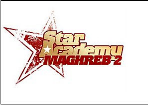
Affiche de l'émission de télé-réalité Star Academy Maghreb 2 , sur Nessma TV

Le choix du public diffère de celui de la production. L'exemple de Marwa, la participante tunisienne à l'édition de 2007 de Star Academy illustre bien nos