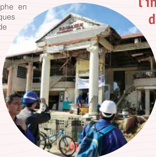
Enquête de terrain post-catastrophe de bâtiment endommagé. Bohol, Philippines.

L'UNESCO soutient les pays en situation de post-conflit et post-catastrophe en apportant des réponses stratégiques par un soutien sur le terrain de façon continue, un personnel qualifié et des mécanismes de soutien administratif dans ses domaines de compétence. L'UNESCO prend activement part aux mécanismes de coordination post-crise des Nations Unies, par l'évaluation conjointe des besoins et la formulation d'appels multi-donneurs. L'Organisation mène des enquêtes sur le terrain post-catastrophe afin d'en déterminer les causes ; ces enquêtes permettent d'éclairer les politiques pour donner naissance à des enseignements appropriés et aider à leur diffusion. L'organisation fournit également une aide pour l'enquête de terrain et la réhabilitation de ses sites par la mise en place d'un Fonds de Réponse Rapide. L'UNESCO forme les enseignants et les parents à un apprentissage interactif ainsi qu'aux aspects complexes de l'éducation d'urgence, comprenant un soutien psychologique pour les enfants et les jeunes.