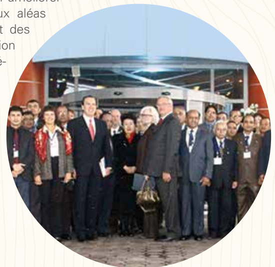
Réduction des pertes causées par les tremblements de terre dans les régions de l'Asie du sud et l'Asie centrale.

L'UNESCO facilite et met en œuvre des ateliers de formation technique et des activités de recherche en matière de réduction des risques de catastrophes pour améliorer les capacités des pays à faire face aux aléas naturels. Ces activités de renforcement des capacités se traduisent par une amélioration des connaissances actuelles, des procédures et des documents de référence dans le but de créer des réseaux d'experts techniques et d'aider les parties prenantes à renforcer leurs capacités dans la gestion des risques de catastrophe.