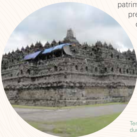
Temple de Borobudur, montrant le travail collectif dans la réadaptation et le développement durable du tourisme.

L'UNESCO encourage les États membres à identifier les risques pour se protéger des différents dangers (y compris le changement climatique) et pour préserver les sites qui ont été désignés par l'UNESCO : sites du patrimoine mondial, réserves de biosphère et Géoparcs mondiaux. En ce sens, l'UNESCO assiste les États membres pour intégrer le patrimoine et la réduction des risques liés aux catastrophes dans leurs politiques nationales de prévention des catastrophes qui comprennent également les plans et systèmes de gestion des biens inscrits au Patrimoine mondial sur leurs territoires. Les réserves de biosphère, grâce à leur engagement à devenir des sites d'apprentissage pour le développement durable dans des écosystèmes uniques, permettent aux États membres de comprendre la façon dont les changements environnementaux influent sur les collectivités. Les Géoparcs mondiaux, quant à eux, jouent un rôle déterminant en mettant en exergue les processus géologiques actifs et la façon dont ils affectent les populations à travers l'histoire. De nombreux Géoparcs mondiaux ont des programmes scolaires sur l'origine des risques géologiques et sur les stratégies d'intervention en cas de catastrophe et sur les moyens de réduire leur impact.