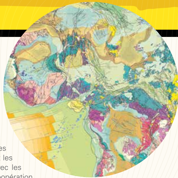
© Commission de la Carte Géologique du Monde/UNESCO

L'UNESCO, grâce à la collaboration scientifique internationale ainsi qu'à ses différents réseaux et programmes académiques, encourage et favorise l'échange de connaissances dans le domaine des risques géologiques, hydrométéorologiques et marins. L'UNESCO mène des activités et des études qui améliorent la qualité des données, la cartographie des risques et les évaluations de vulnérabilité. L'UNESCO travaille en étroite collaboration avec les institutions nationales, les centres et chairs de l'UNESCO en promouvant la coopération inter-institutionnelle et régionale.