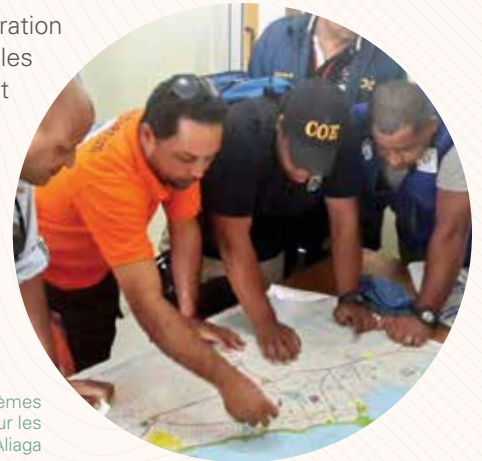
Exercice de simulation au cours de l'année 2014 sur les systèmes d'alerte précoce des tsunamis et autres risques côtiers pour les Caraïbes et les régions adjacentes.

L'UNESCO promeut les échanges scientifiques et encourage les efforts de collaboration sur la prévention des risques et catastrophes naturels. Dans ce cadre, elle aide les États membres à mettre en place collectivement des systèmes de surveillance et d'alerte efficaces en cas de risque de tsunamis, glissements de terrain, éruptions volcaniques, tremblements de terre, inondations et sécheresses. Afin d'établir des systèmes d'alerte précoce efficaces, l'UNESCO participe à la coordination des centres de recherche existants et éduque les communautés à risque sur les mesures préventives, notamment la mise en place d'exercices collectifs et de procédures standards d'alerte et d'urgence. L'UNESCO favorise également les approches collectives dans l'élaboration de plans d'intervention et de campagnes de sensibilisation qui impliquent fortement les établissements d'enseignement et les utilisateurs finaux.