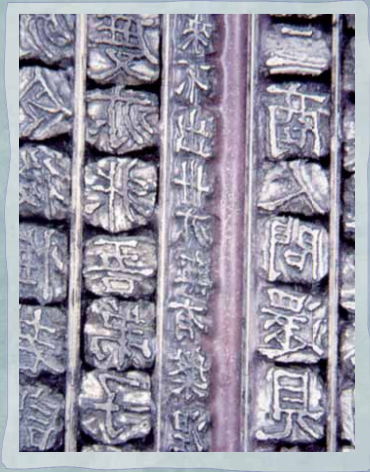
Caractères métalliques restaurés du Jikji République de Corée

P con syste dunt ameconum enit utet ab consectet, e seiniisi ero enguerat pras nullaor suste engiatum dolo erosi cineipisi blan per sit