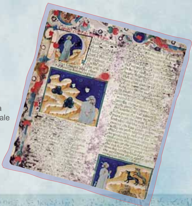
Dante: la Divina comedia