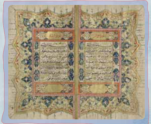
al-Qur'an Date : 1211 A.H. (1796 C.E.)