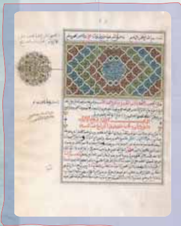
Les Manuscrits de Tombouctou

Par la formation et la modernisation des équipements, le projet augmentera la capacité de l'Institut Ahmed Baba (IHERI-AB) d'accomplir les missions essentielles de conservation, d'exploitation et de diffusion scientifiques du contenu des manuscrits actuellement en sa possession ainsi que des collections conservées dans d'autres bibliothèques de Tombouctou.