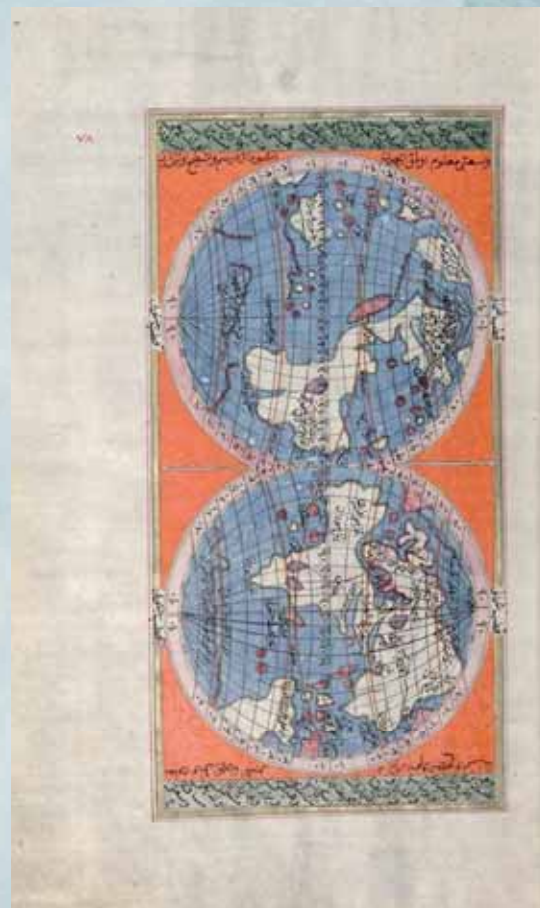
Ibrahim Hakki Date : 1813 A.D. / 1228 A.H.

* Inscriptions conjointes entre 2 ou plusieurs pays.