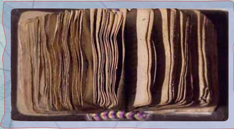
Le manuscrit arménien le plus petit (pèse 19 grammes). Il s'agit d'un calendrier d'Église.

...at vel quatumq; andipm seimisi erostio nequam