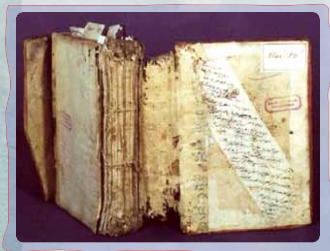
Dégâts causé par des insectes sur un manuscrit oriental Daté aux environs de l'an 1276