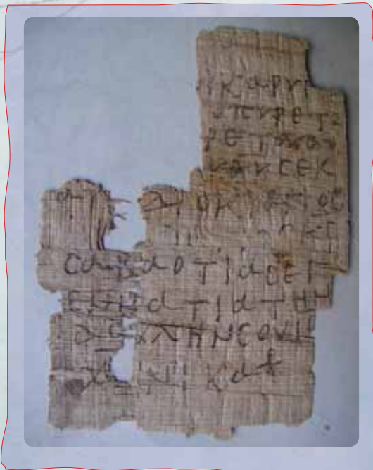
Christian Amulet Papyrus Egyptien