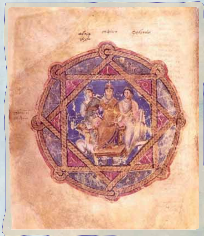
Vienna Dioscurides, MS: Cod. med. Graec. 1 Début du 6 ème siècle

Ensemble, nous devons agir pour préserver ce patrimoine, mobiliser nos efforts et nos ressources pour que les générations futures puissent jouir de cet héritage. Ne pas réagir entraînera la perte de chapitres entiers de notre patrimoine et conduire à l'appauvrissement de notre identité.