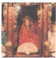
Tín ngưỡng Tam phủ thờ Mẫu

Inventory Others → Space of Gong Culture in the Tay Nguyen