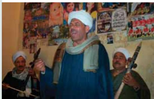
👉 La epopeya Al-Sirah Al-Hilaliyyah (Egipto)

Patrimonio cultural inmaterial jani uñjkaya jani llamkht'kaya yänaka waqaychañatakixa, yaqha wakisirinakawa amuyt'aña wakisi, uka yänaka jakaskañapatakixa yaqha uraqinakawa wakisiraki. Taqi ukanaka jakaskañapatakixa, ayllunkiri jaqinakapana apnaqata ist'ayata jutiri wiñanakatakixa ch'amanchataskañapaxa. Ayllunkiri jaqinakapaxa taqi ukhama luraña phuqhañanaka jakayañatakixa pachpa amuyunakani lurañanapanixiwa, taqi ukanakaxa arumpi chikawa mayni masinapakata yatiyasa ch'amanchaskapxi. Ukhamaxa, ayllunakapana wakiskiri waqaychañatakixa, waljanisa jani ukaxa sapa maynisa taqi ukhama yatñanaka waqaychirixiwa.