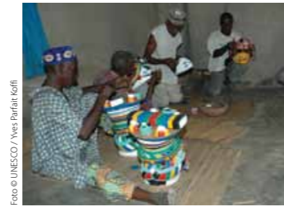
El carnaval de Barranquilla (Colombia)