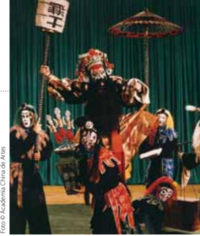
La ópera Kun Qu (China)