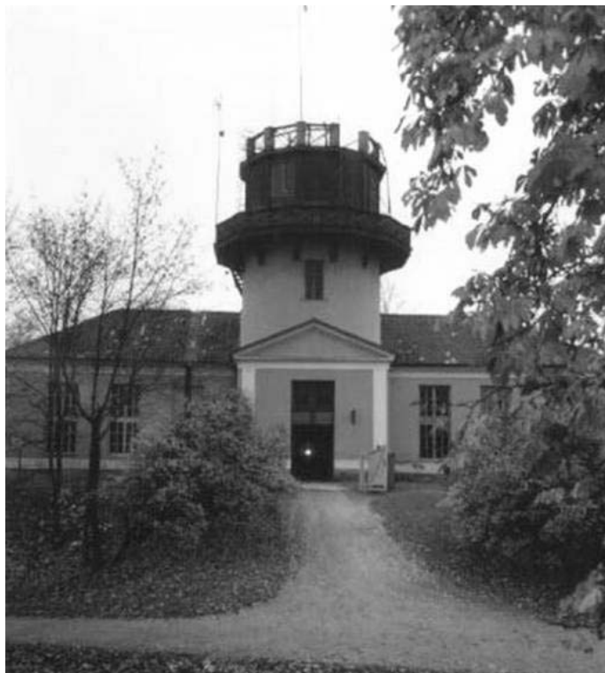
L'observatoire de Tartu - Tartu, Estonie – Dorpat (19)