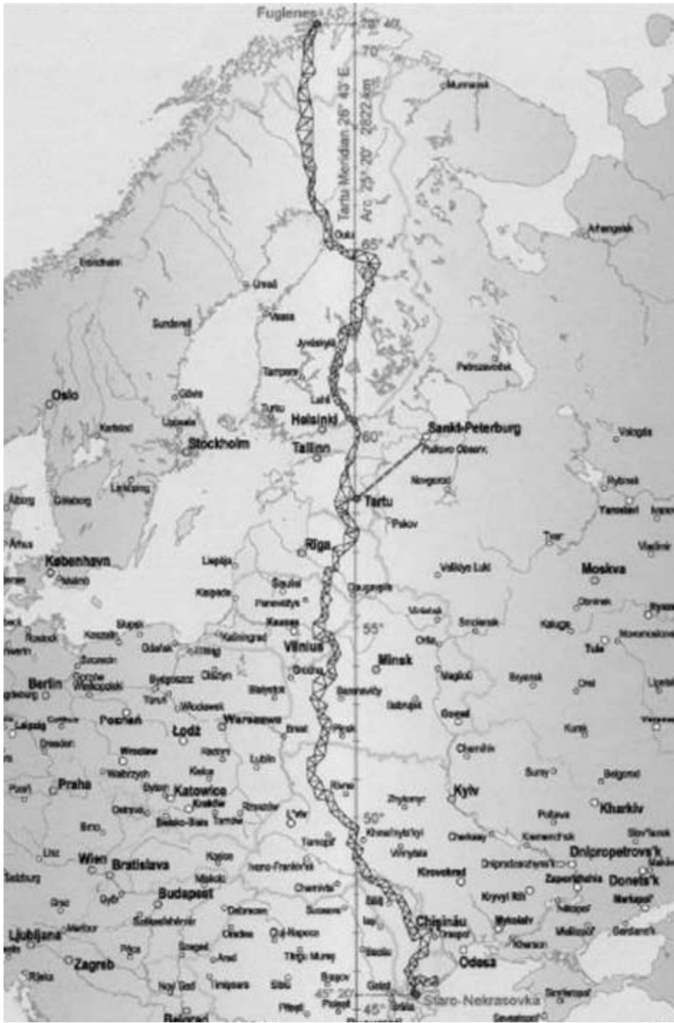
Map showing the location of the nominated property