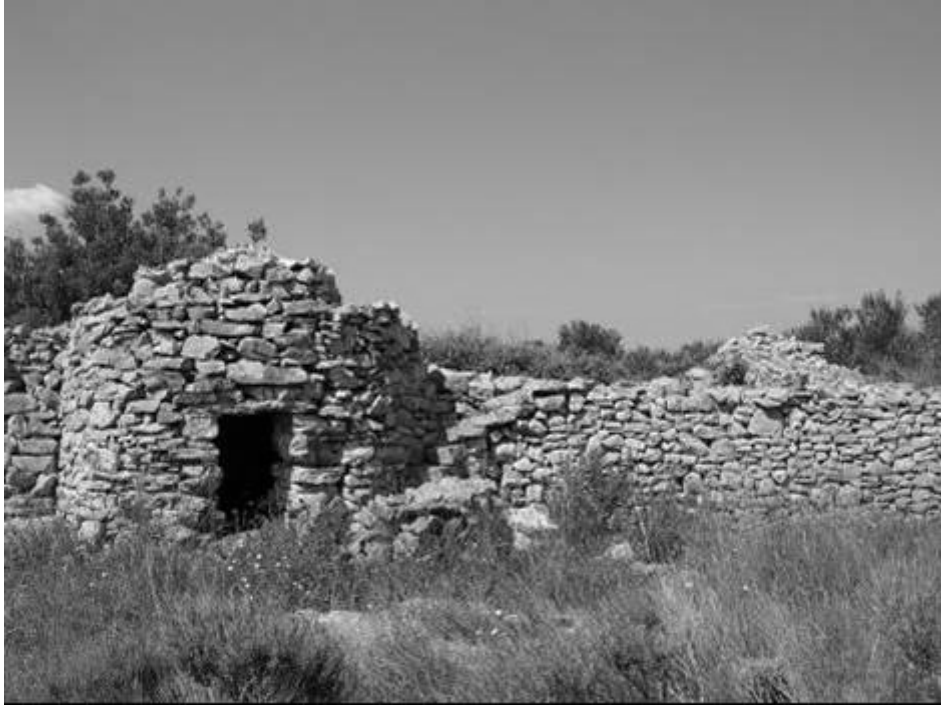
Borie et murs de pierres sèches