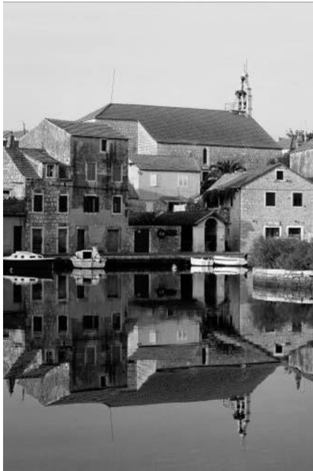
Vrboska : église Saint Laurent