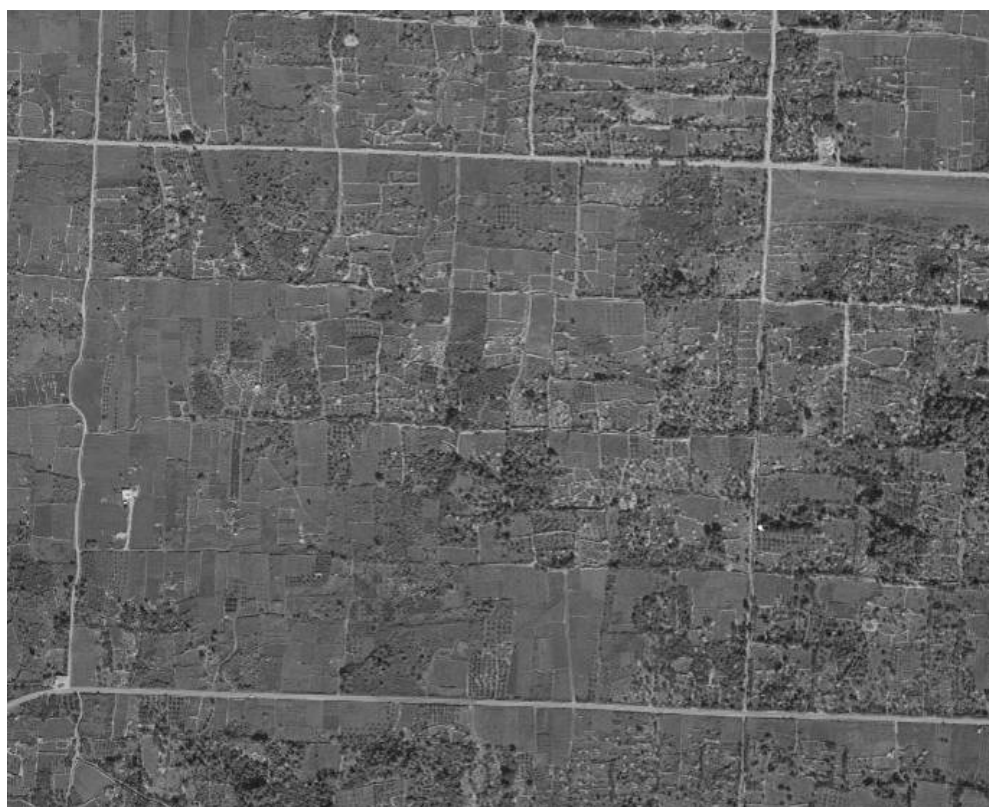
Plaine de Stari Grad : division des terres à Male Moče