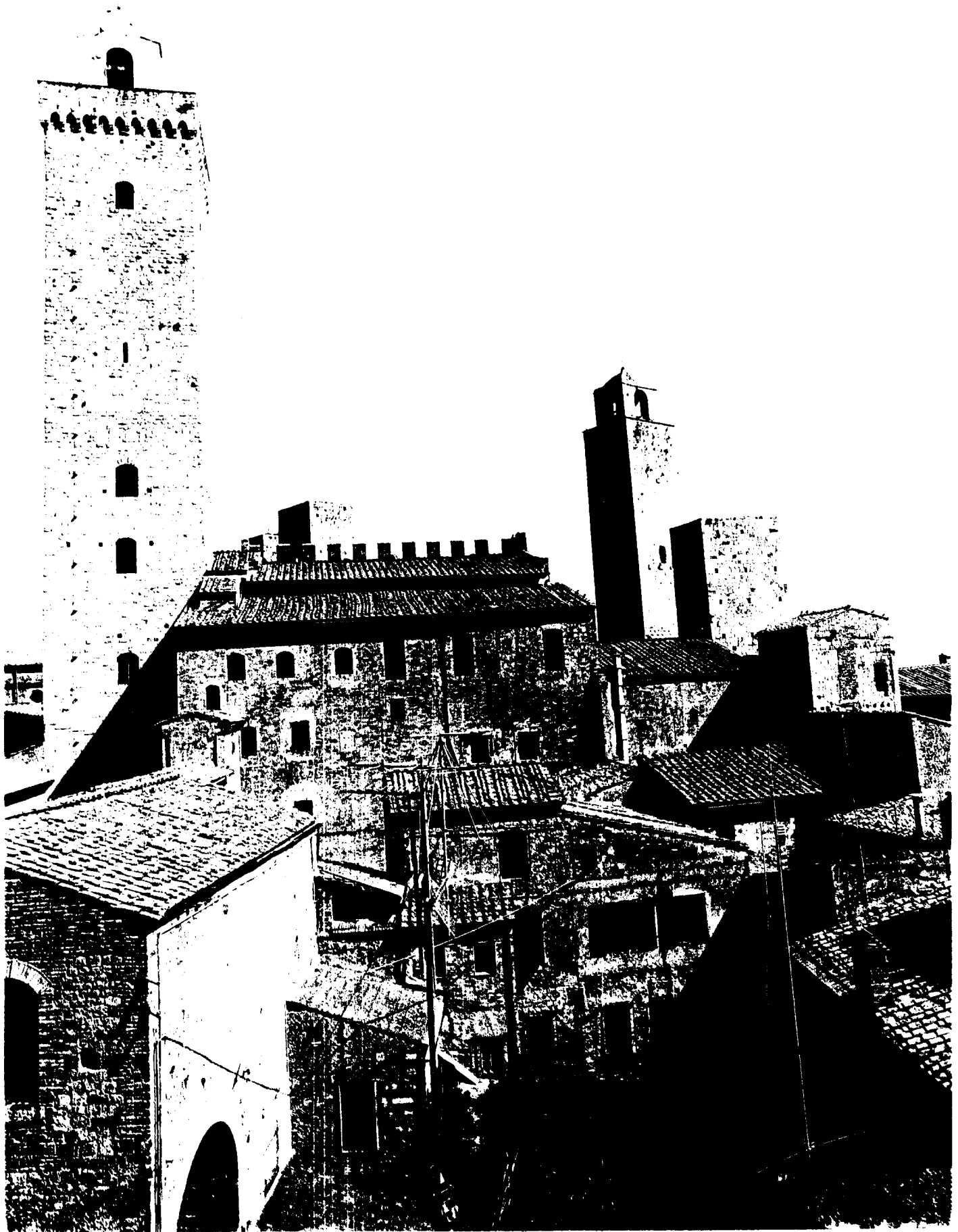
San Gimignano: Vue depuis l'arrière du Palazzo Pubblico / San Gimignano: View from the rear of the Palazzo Pubblico