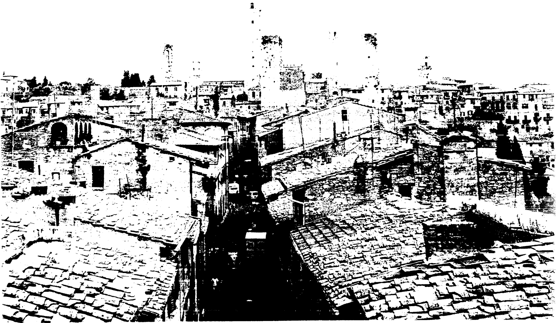
Vue d'ensemble de San Gimignano / General view of San Gimignano