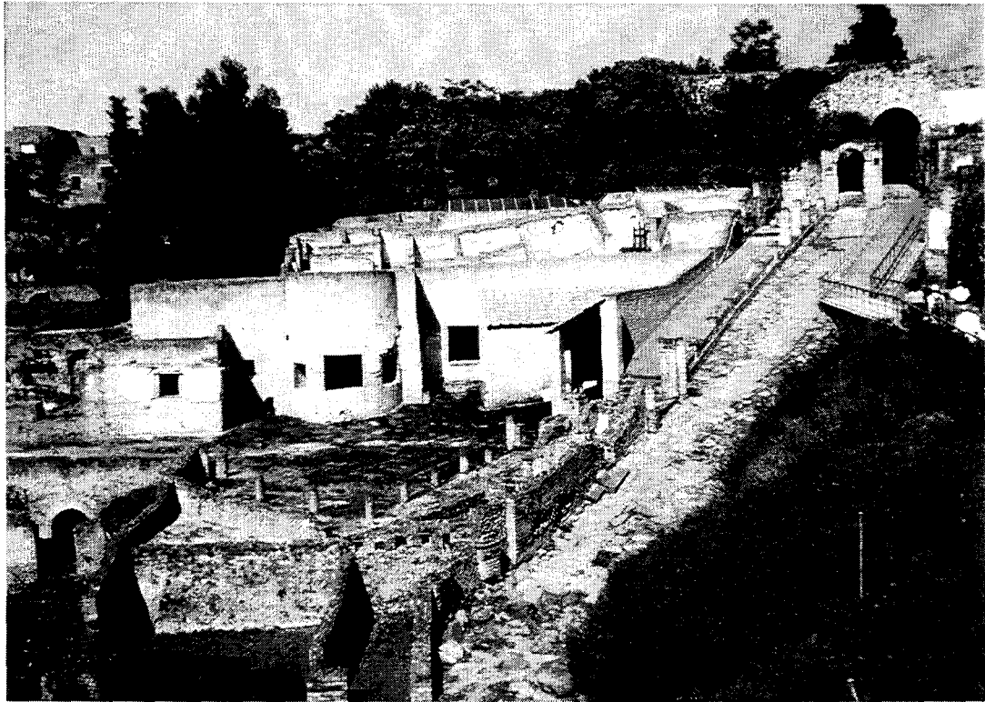
Pompéi / Pompei : La Porte Marina et les thermes suburbains / The Marina Gate and suburban Baths