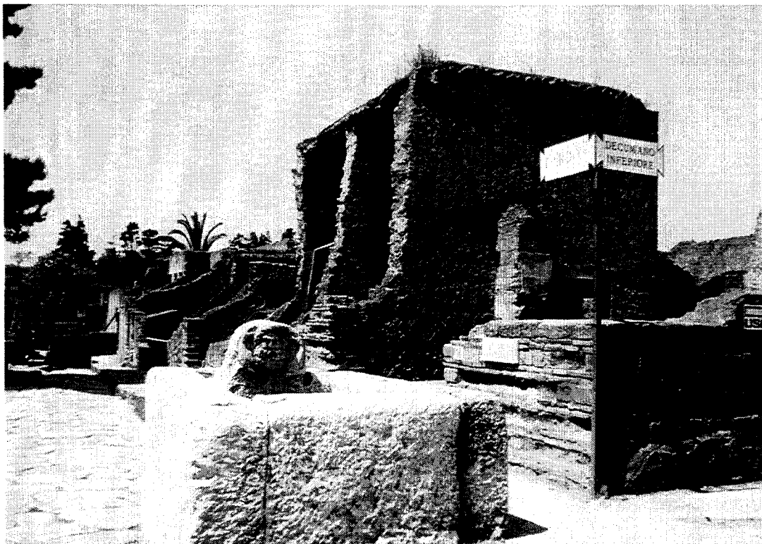
Herculaneum / Ercolano : Rue avec fontaine publique / Street scene, with public fountain