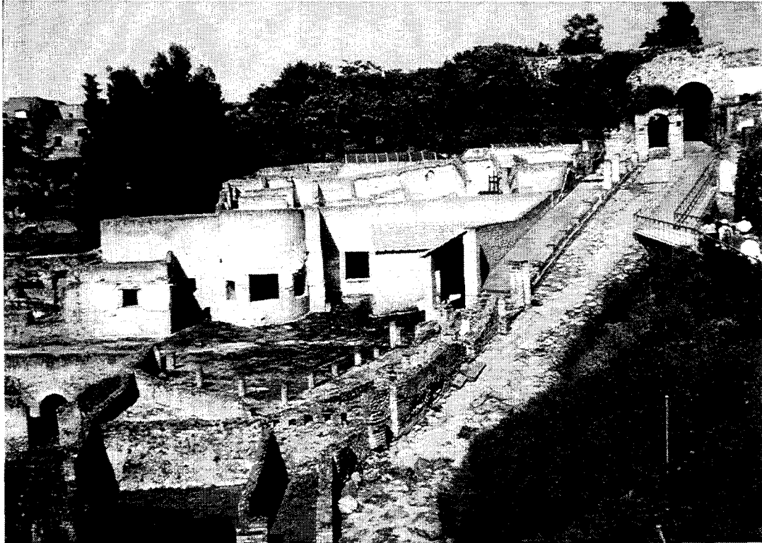
Pompéi / Pompei : La Porte Marina et les thermes suburbains / The Marina Gate and suburban Baths