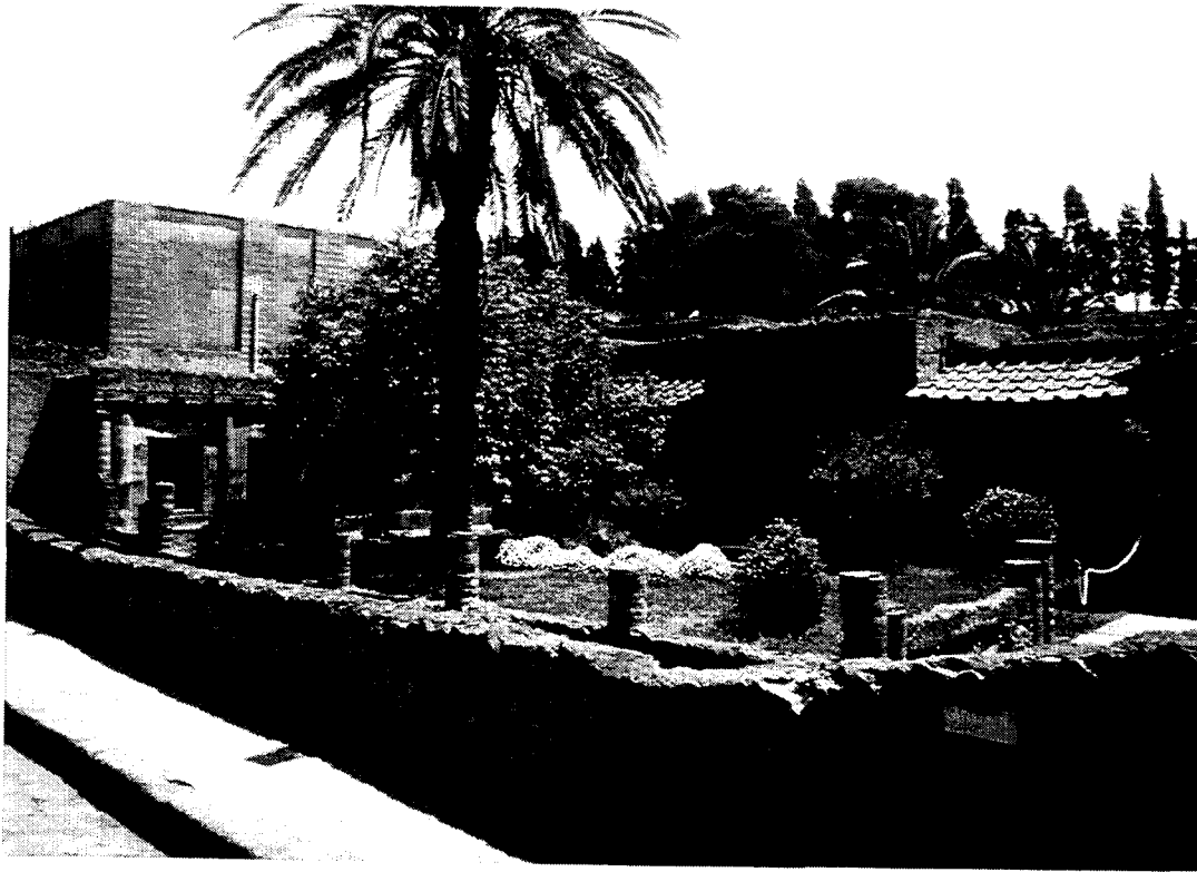
Herculaneum / Ercolano : Maison de l'atrium aux mosaïques / The House of the Mosaic Atrium