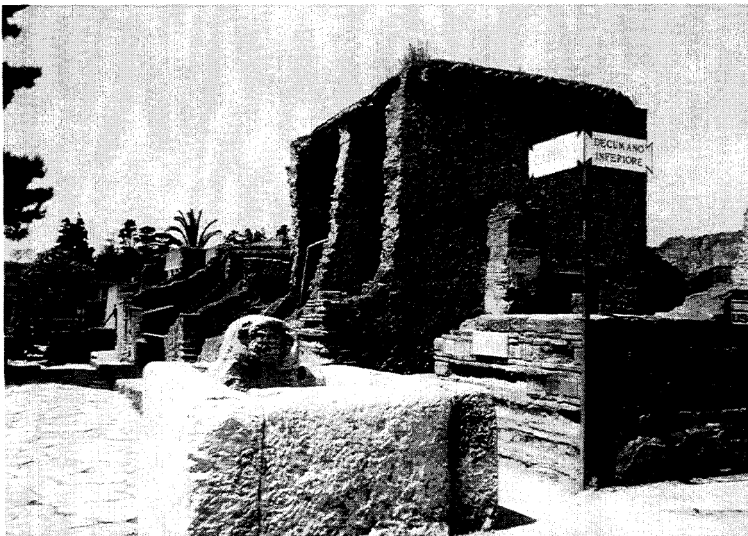
Herculaneum / Ercolano : Rue avec fontaine publique / Street scene, with public fountain