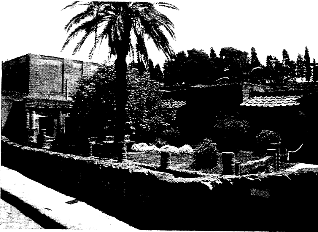
Herculaneum / Ercolano : Maison de l'atrium aux mosaïques / The House of the Mosaic Atrium