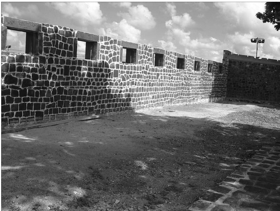
Quartier des immigrants