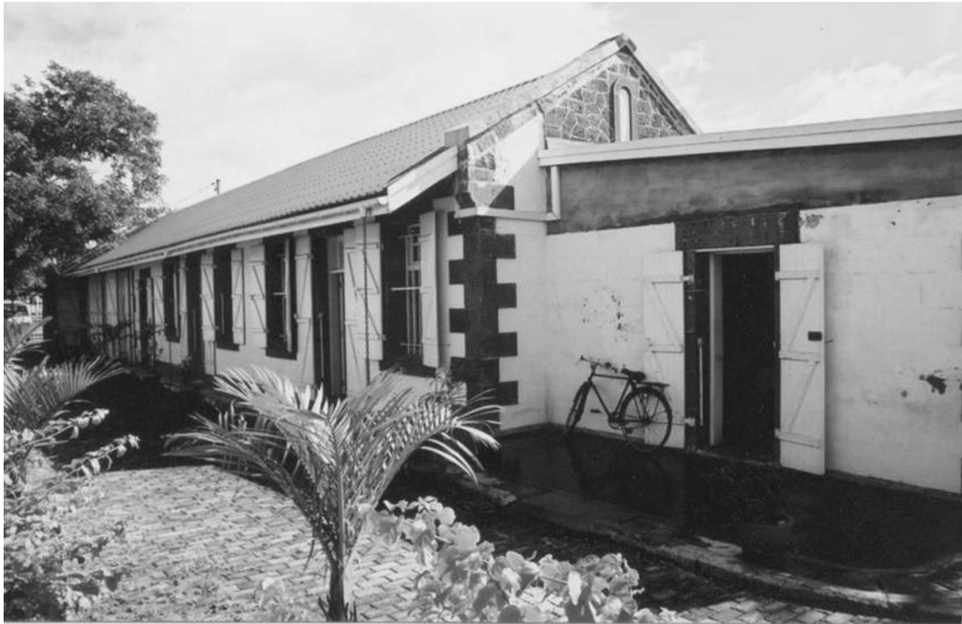
Bâtiments de l'hôpital