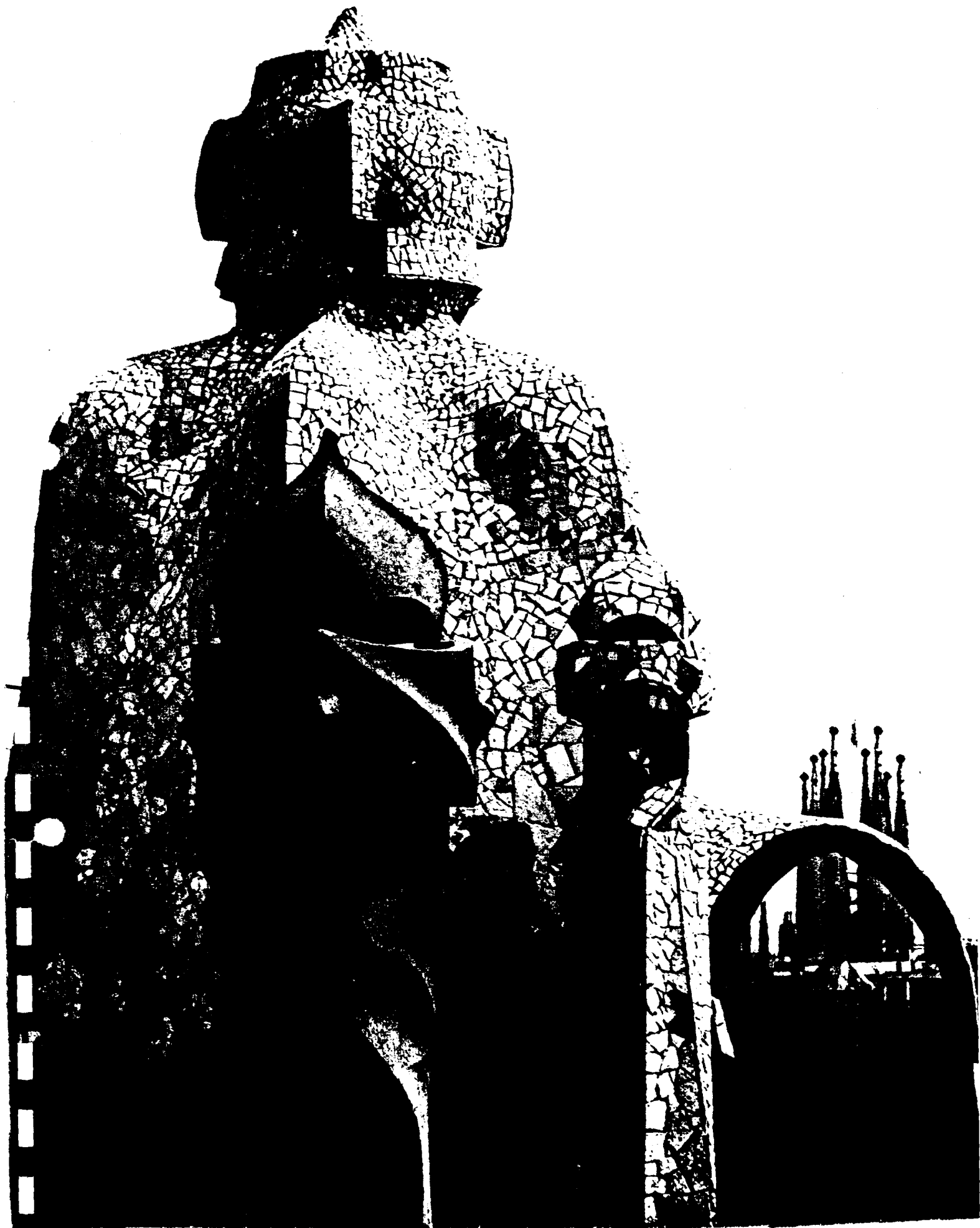
BARCELONE - MAISON MILA