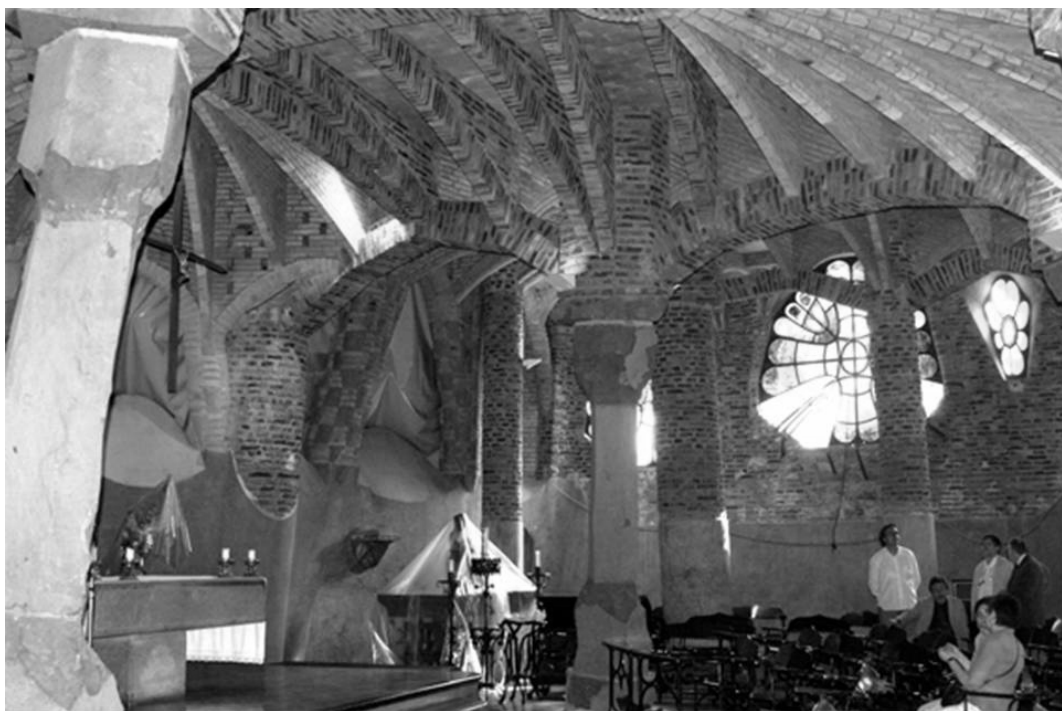
Crypt at the Colònia Güell