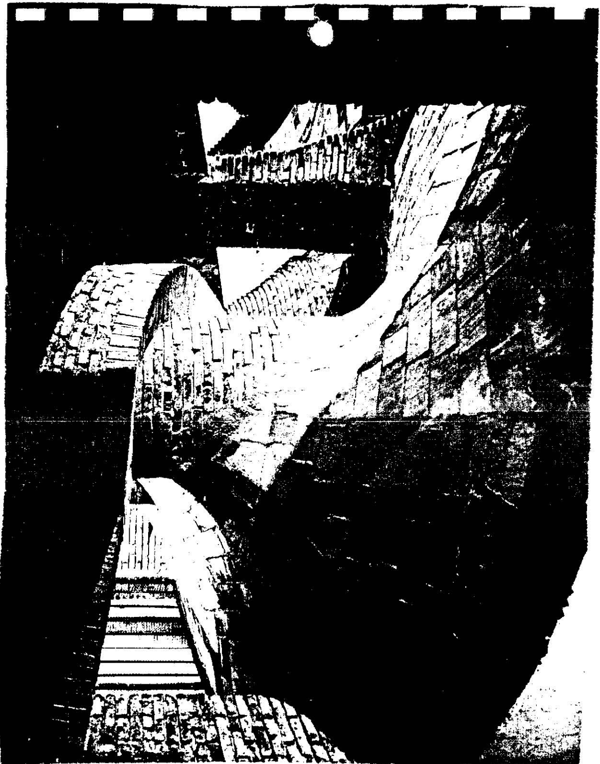
BARCELONE - PALACIO GUELL