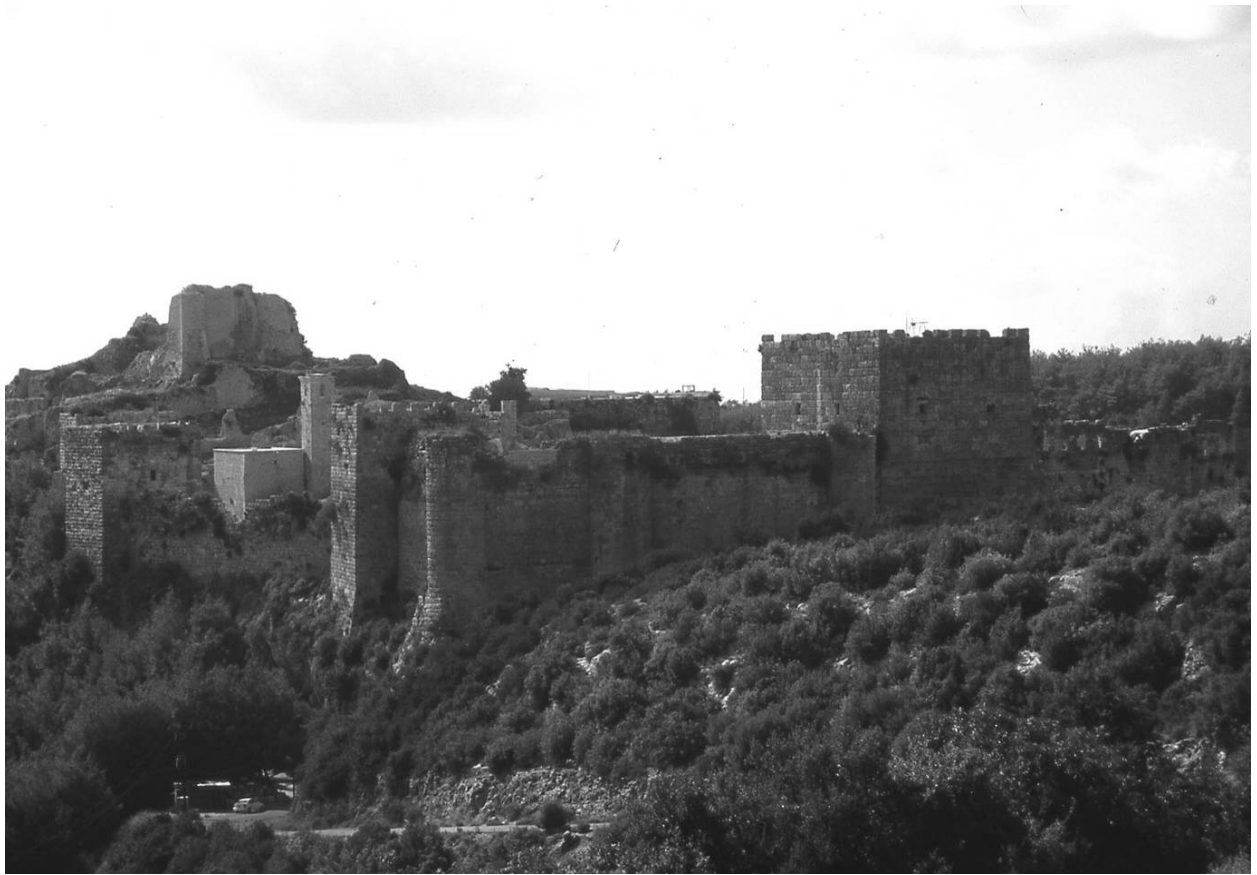
Fortress of Saladin