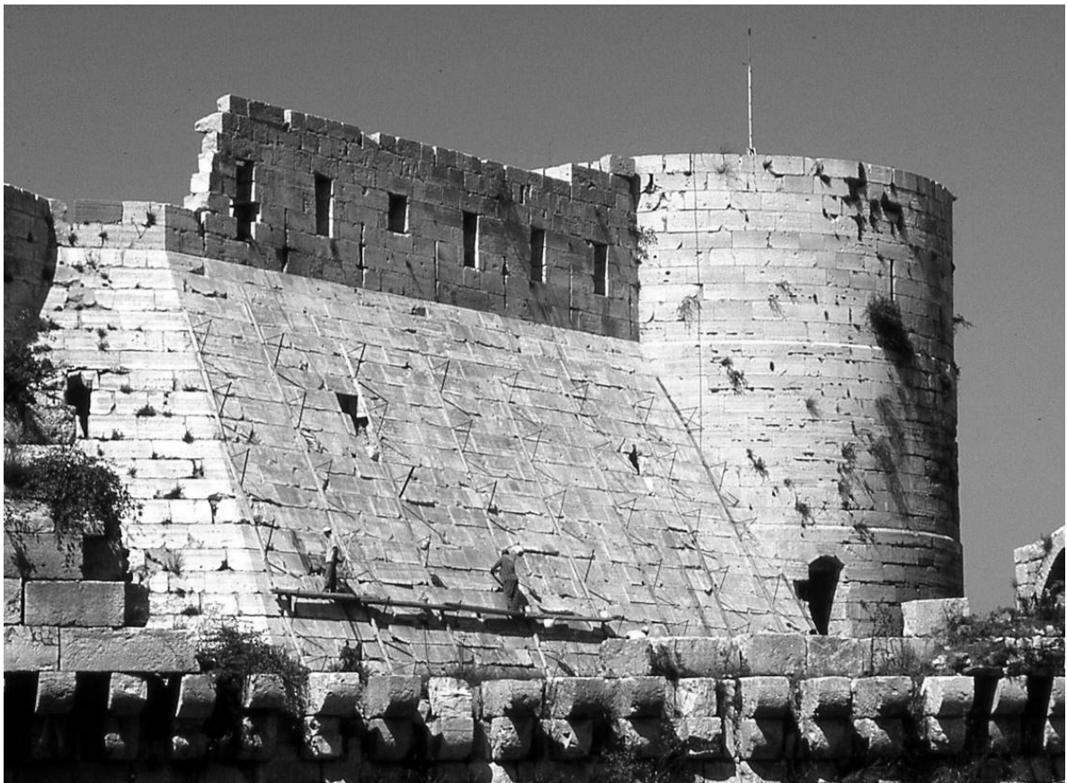
Glacis et donjon