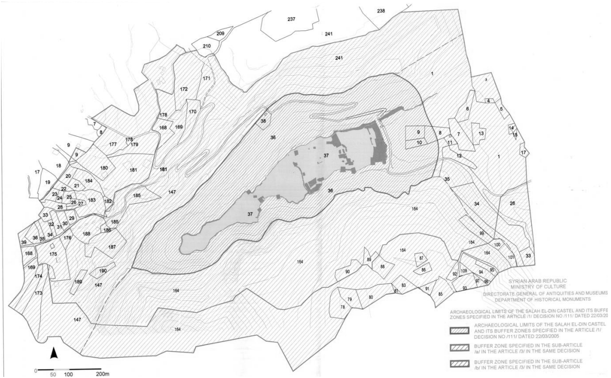
Map showing the boundaries of the Fortress of Saladin