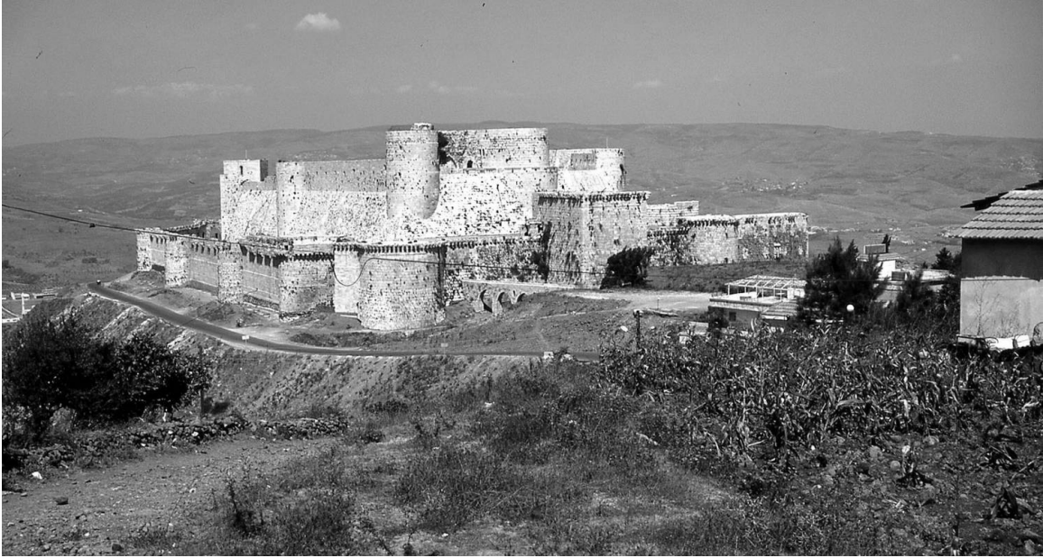
Crac des Chevaliers