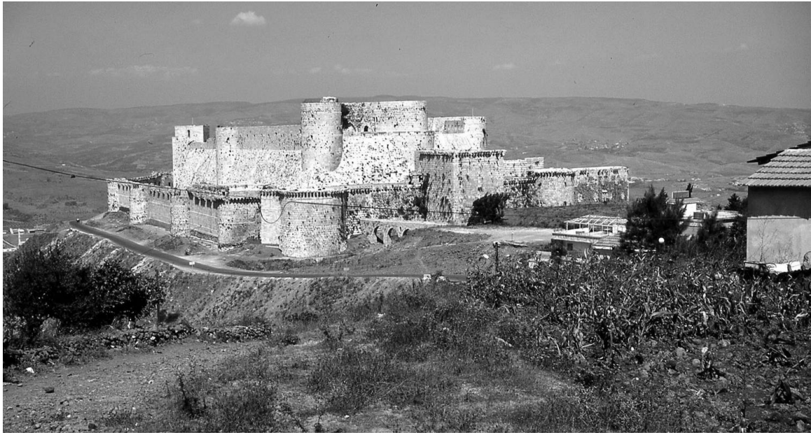
Crac des Chevaliers