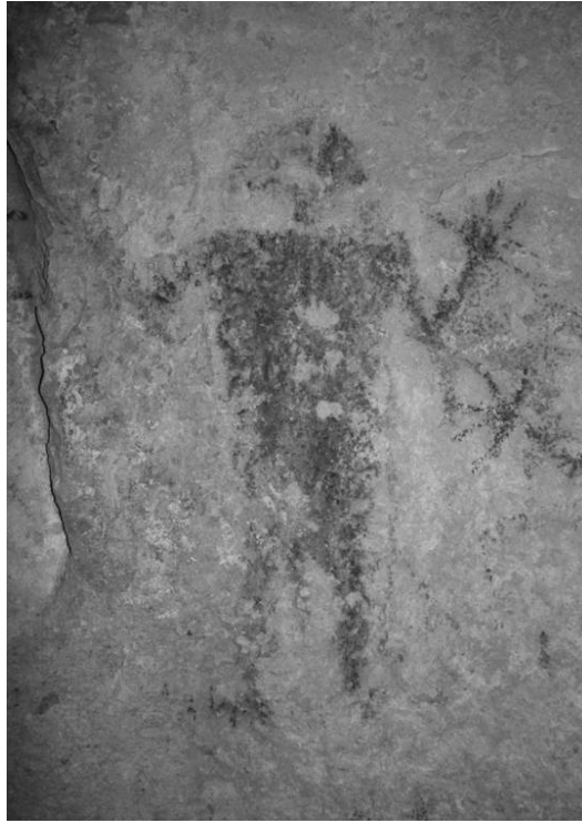
Représentation possible d'art rupestre du roi Mata, Fels cave