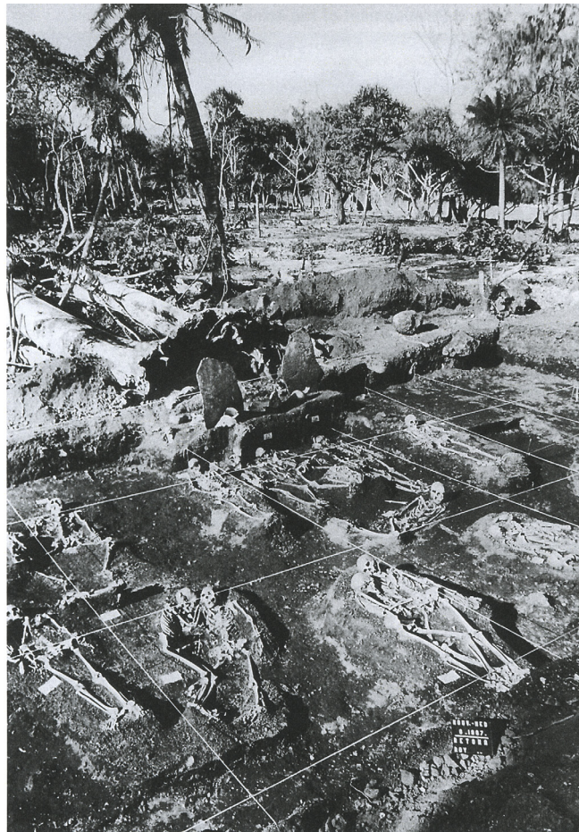
Roi Mata's mass burial site, Artok Island