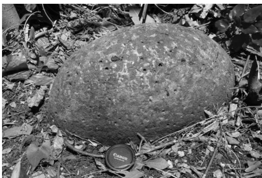
Roi Mata's magic stone