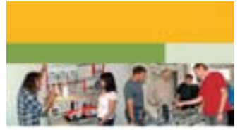
Approaches to Action Learning in Technical and Vocational Education and Training (TVET)

صدر هذا الكتاب عن اليونسكو ويونيفوك و InWent وهو يُسَطّر مبادئ التعلّم الفاعل بصفته اختصاص وينظر في تبعات هذه المقاربة لتلقين التعليم والتدريب المهني والتقني. وهو يُعرّف عن نماذج عمليّة نظريّة ويبيح نظرةً شاملة لمفاهيم تعليم مختارة قائمة على التعلّم الفاعل. والغاية من هذا الإصدار تحفيز الأساتذة وتمكينهم من دمج المفاهيم المنهجية المتباحث بها في تعليمهم. وترد الأمثلة لدعم العناصر المنطقية. يُمكن تحميل النسخة باللغة الإنكليزية مجاناً عن الموقع: www.unevoc.unesco.org أو طلب نسخة من الموقع order@unevoc.unesco.org