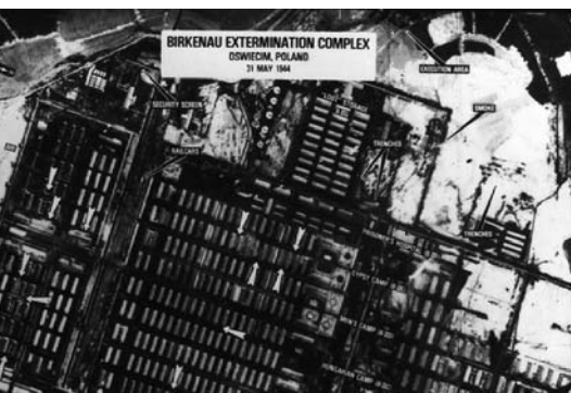
1979年，奥斯威辛-比克瑙德国纳粹集中营和灭绝营列入联合国教科文组织世界文化遗产名录

在卢旺达的图西族种族灭绝惨剧中，曾有人利用无线电广播扩大种族主义宣传和帮助凶手识别受害者，这也明白无误地说明了这一点。认识到技术的力量可以帮助学生分析当代的侵犯人权问题，继而联系到防止侵犯人权的政治行动。鉴于近年来技术发生了深刻的变革，这一点十分重要。