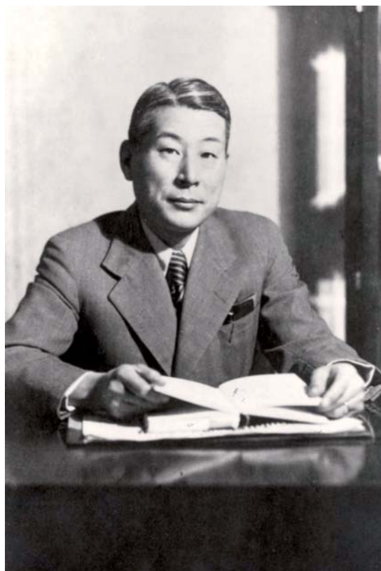
日本驻科夫诺总领事杉原千亩签发了2 000多份签证，帮助犹太难民逃离欧洲。

在另一个层面上，一些宗教领袖反对纳粹头目在德意志帝国推行旨在谋杀残疾人的“T4安乐死”政策，彰显了行动的力量。一些非犹太裔德国妇女也采取了非同凡响的行动。1943年2月，这些妇女举行“玫瑰大街”游行，抗议当局逮捕她们的犹太裔配偶。这些妇女的抗议不断升级，直到1943年3月她们的配偶获释。这些实例表明，建设性的个人和集体行动有时能够对剥夺其公民基本人权的暴虐政权产生积极影响。