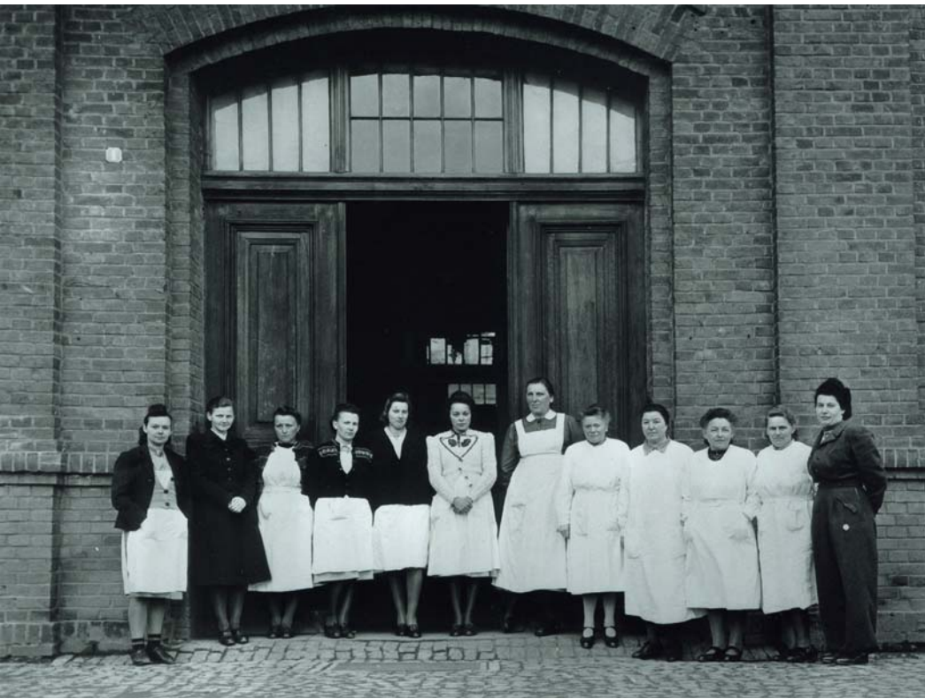
德国哈达马尔“安乐死” 中心护理人员