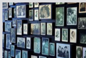
奥斯威辛-比克瑙集中营国家博物馆家庭成员肖像展