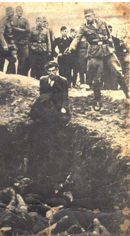
1941年7月，乌克兰芬尼特查：德国士兵围观 德国特别行刑队一名士兵杀害一名犹太人

“T4行动”的安乐死计划中的所作所为（在6年时间内，该计划导致20多万名患有身心残疾的男女成人和儿童被杀害）。同样，作为特别行刑队在东欧的一项工作，德国正规军参与屠杀了超过100万名犹太人，由此引发了对于人类行为、盲从和意识形态力量的拷问；简言之，社会依附于政府大肆施行侵犯国际公认人权行动的原因究竟何在。开展关于反犹太屠杀的教育可帮助年轻人理解某些关键概念，而这在他们研究其他大规模暴力事件实例时，会起到帮助作用。小学生们将能利用自己对反犹太屠杀的理解，来探讨其他大规模侵犯人权事件的历史，并进一步意识到自己作为全球公民肩负的责任。