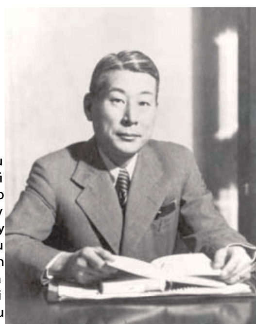
Taxawalkatu Japon ca Kovno, Siume Sempo Sugihara, joxe na lu ëpp 2000 wiisaa yu tax ay daw-làqu Yawut mën a jóge Ęrob ba.

Ci beneen wet, mën-mënu jëf ju deme noonu dafay feeñ bu baax su ñu seete jógali njiiti diine yi ci tëralinu jekkali rey « Definu T4 » bi jëmoom doon neenal way-laagoy Réew ma. Naka noonu itam la ñu fése jógali ay jigéeni alma yu duloon yawut yu, ci febarye 1943, wonewu ca mbeddu Rosen ba ci li ñu jàppoon seeni jëkkari yawut. Ñu def ay dajaloo yu bare ba ñu bàyyi seeni jëkkar ya ci mars 1943. Misaal yooyu wone nañu ni ay jëfi defare yu takku yu ay ñenn mbaa mbooloo mën nañu yenn saa yi jeñtal lu baax nguuri nooteel yuy xañ mbokk-réew yi seeni yelleef yu lalu yi.