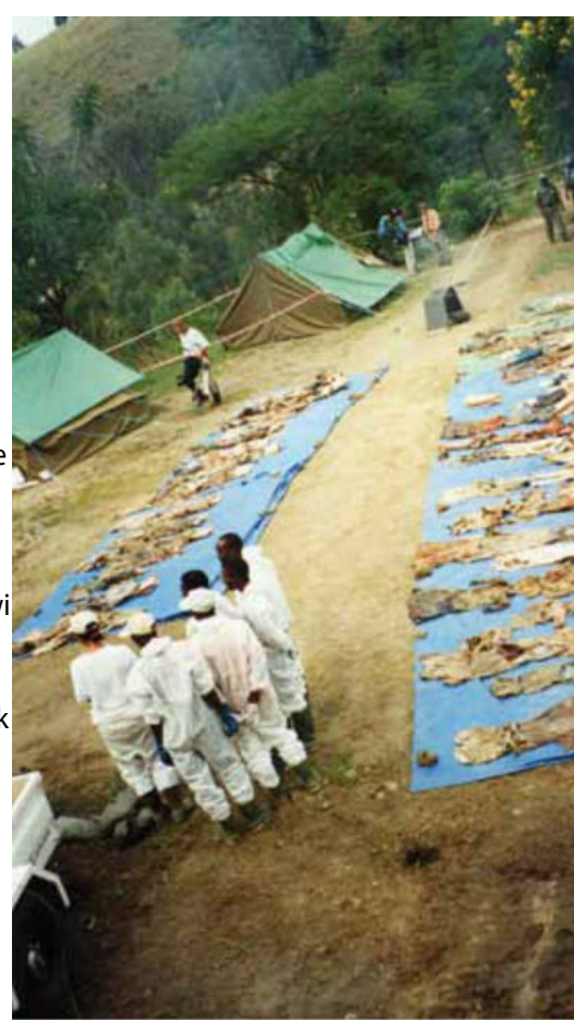
Bàmmeelu mbooloo ca Rwanndaa

Waaye, ak sax li réew yi am ndam yu 1945 yi saxoo dakkal ñaawteefu yu mel noonu te ñu amal ab déggoo ñépp bu soloo fàggu jéfi raafal xeet ëllëg (Mànkoo Mbootaayu Xeet yi ngir fàggu ak daan bàkkaaruu raafal xeet, 1948), yeneeni metital yu ni mel am nañu ci béréb yu barey àddina si gannaaw njeextee Ñaareelu Xarey àddina sa ba tey. Ak baamtu ñaawteefi niteefadi yooyu, ay gaayi politig, ay gëstukat ak ay mbokk-réewi àddina sépp sukkandiku nañu ci xabaar ak «njàngati» Olokost bi ngir jéem a leeral naka la nit ñi defati ba bañ a mën a antul seeni jéem a fàggu raafal xeet bi. Lan la nu gëstu ci Olokost bi ak yeneeni ñaawteefi nasi ya mën a jàngal ci fàggu raafal xeet yi ak metital yu jéggi dayo yi ?