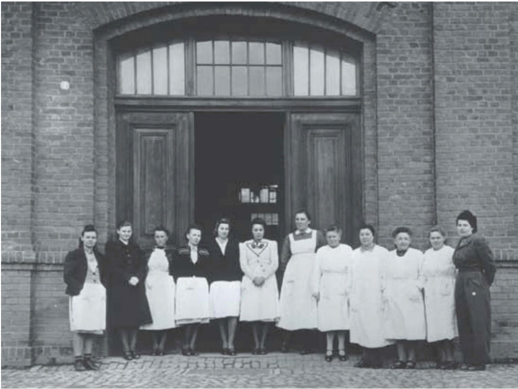
Ay sóor ca Sàntaru « yeggale rey » bu Hadamar, Almaañ