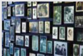
Wonaley portaley njaboot caMiiseb Réew bu Auschwitz-Birkenau

Dinay yombal xam yi benne ak wuute ci anam yu bare yi ñu gëstu. Waaye, su amee njeriñ bu baax ci njàngalin mi ñuy dendale gëstuy raafal-xeet yi, am na solo bu baax itam ñu bañ a dendale metit yi ak di gëstu xew-xew bu ci nekk ak cosaanu boppam. Bu ñu dee sumb gëstu Olokost bi, jàngalekat yi dañu wara ittewoo politigi neenal yu barey Almaañu nasi ya ak farandoom ya. Bu ñuy dugg ci yeneeni raafal-xeet, dañu war a seetlu politig yi soxal bu ci nekk.