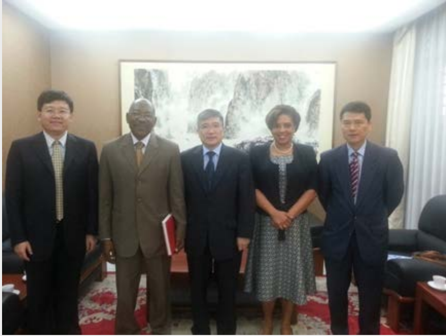
Meeting of the UNESCO Congo Brazzaville Office and the Chinese Embassy. Réunion de représentants du Bureau de l'UNESCO à Brazzaville et de l'Ambassade chinoise.