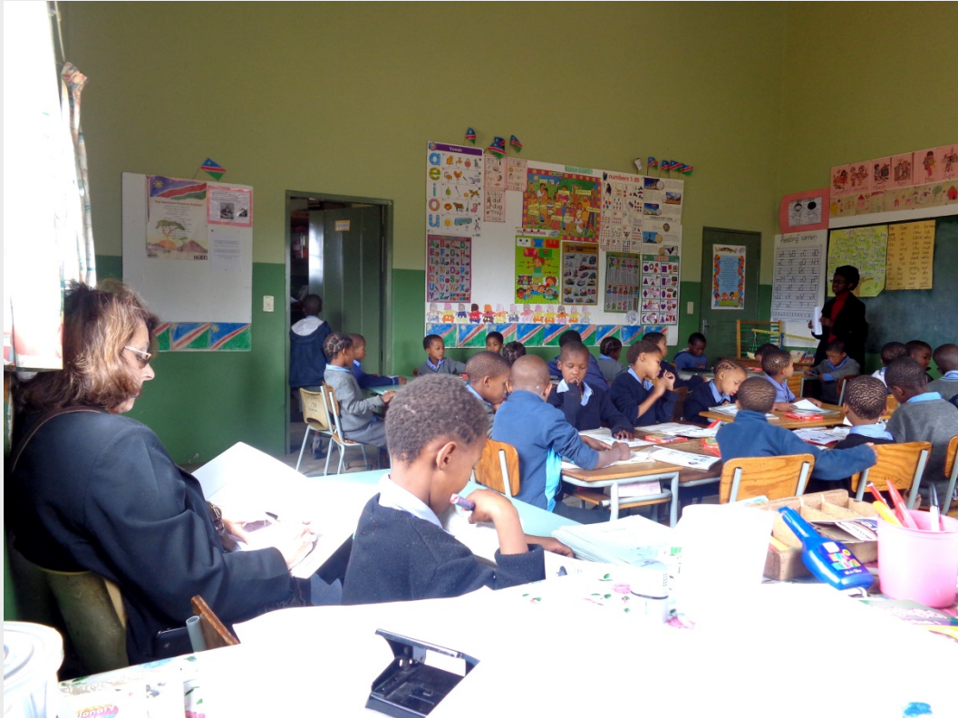
Action research in a classroom. Action-recherché dans une classe.

les besoins d'éducation au niveau préprimaire et dans le premier cycle du primaire. Un rapport de recherche national, en cours d'établissement, servira de base pour réaliser des interventions de grande ampleur à l'aide des outils nécessaires pour améliorer les domaines pertinents. Les outils de recherche sont disponibles sur UNESTEAMS .