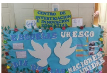
Celebraciones del Día de Naciones Unidas en Honduras