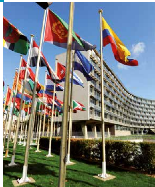
Het hoofdkwartier van Unesco in Parijs.

Het is Unesco's missie om een bijdrage te leveren aan wereldwijde vrede, uitroeiing van de armoede, duurzame ontwikkeling en een interculturele dialoog door middel van onderwijs, wetenschap, cultuur, communicatie en informatie. Unesco is ervan overtuigd dat het van wezenlijk belang is om te leren over de Holocaust. Op die manier kunnen we beter begrijpen hoe Europa is kunnen afglijden naar deze genocide. Zo krijgen we een inzicht in de daaropvolgende ontwikkeling van het internationaal recht en de internationale instellingen die erop gericht zijn genocide te voorkomen en te bestraffen. Door een zorgvuldige vergelijking met andere voorbeelden van massaal geweld kunnen wij bijdragen aan het beter begrijpen van de onderliggende mechanismen en de preventie van toekomstige genocides of andere vormen van grootschalige gruweldaden.