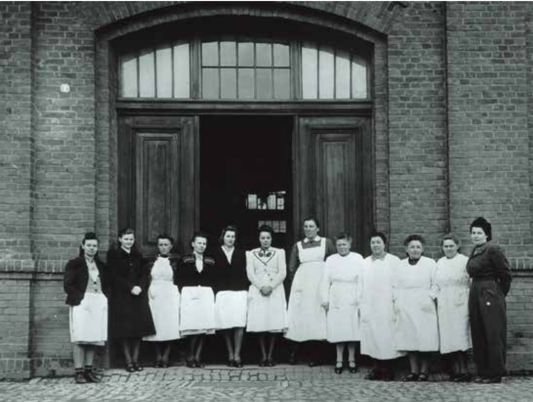
Het verplegend personeel van het 'euthanasiecentrum' Hadamar in Duitsland.