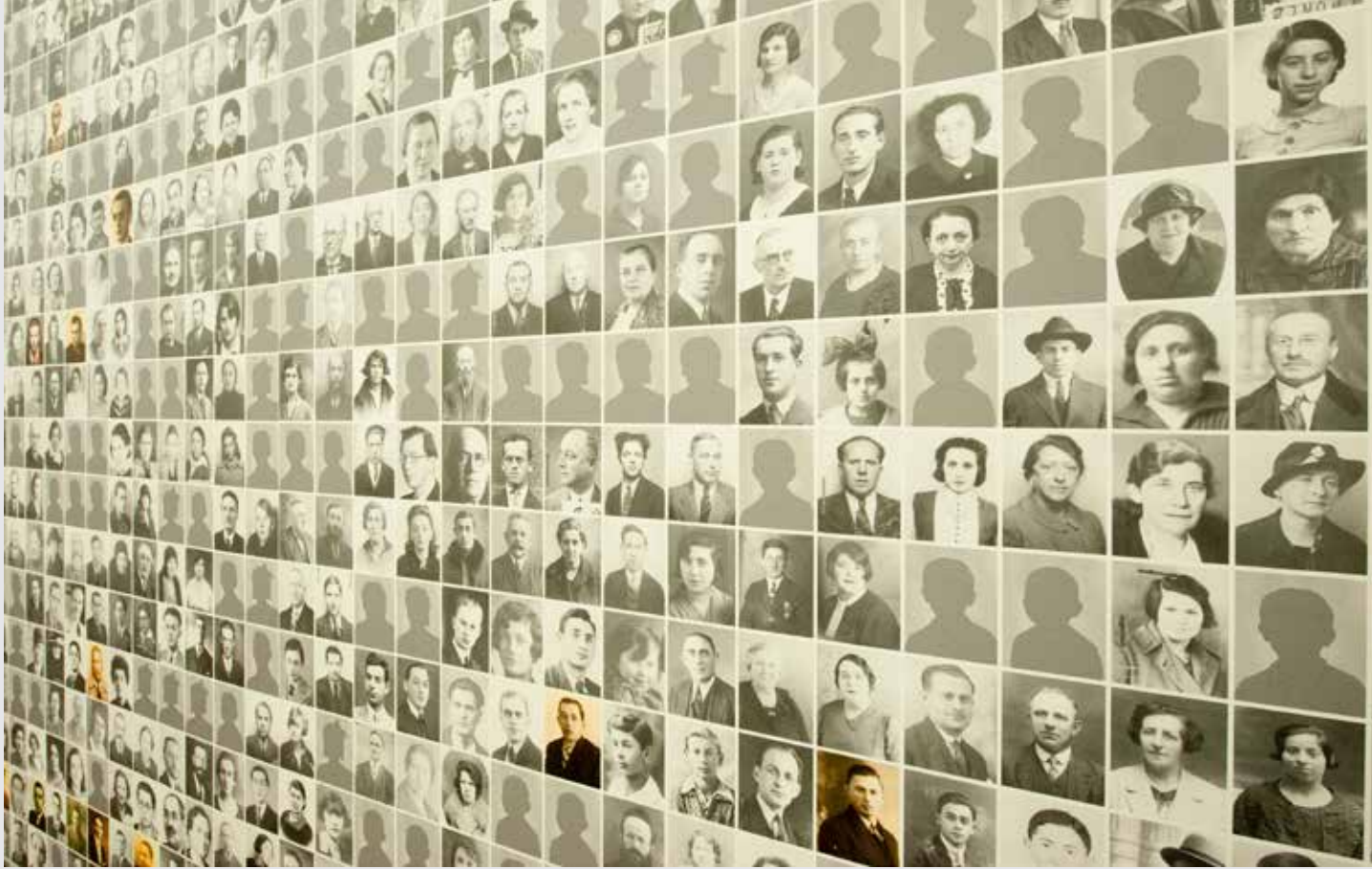
De herdenkingsmuur met portretten in Kazerne Dossin