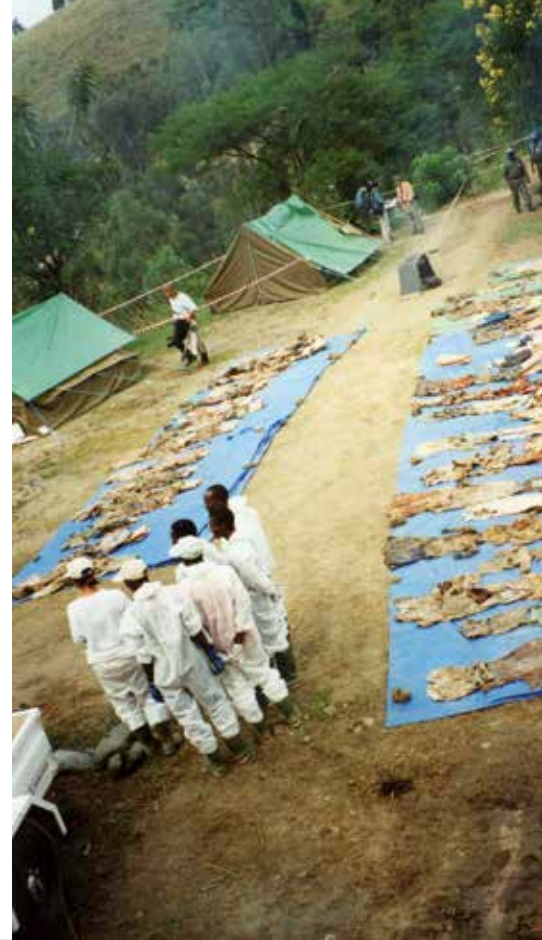
Massagraf in Rwanda.

Wat kunnen we leren over de preventie van genocides en andere massale wreedheden door de Holocaust en andere nazimisdaden te bestuderen?