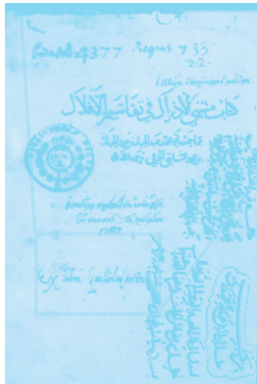
Illustration dans «Whose Science is Arabic Science in Renaissance Europe» © George Saliba, Columbia University Illustration in «Whose Science is Arabic Science in Renaissance Europe» © George Saliba, Columbia University