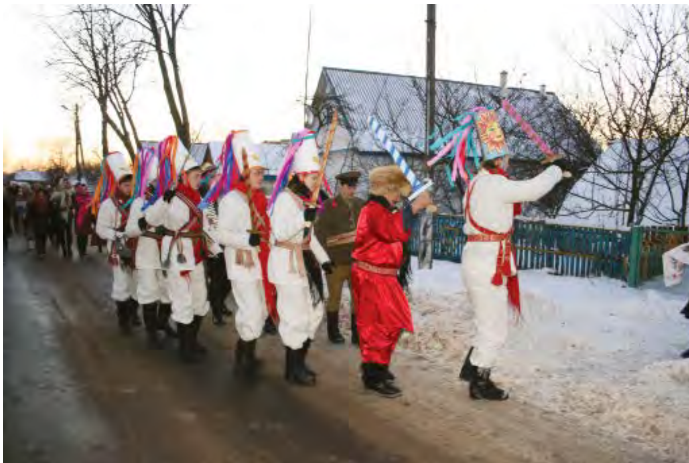
Шествие «царей» по деревне. Procession of "tsars" through the village.

Originally it was 'Kalyady' game in which only young men actively participated. Historical roots of 'Kalyady' are in