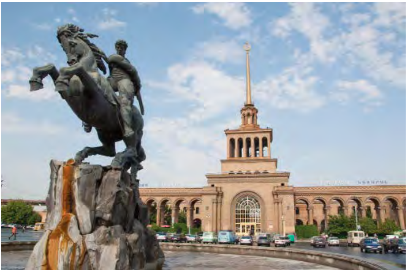
Памятник Давиду Сасунскому в Ереване. The Statue of David of Sassoun in Yerevan.

Different social organizations targeting preservation of this cultural heritage have been established. Communities have clubs teaching children Epic and organizing national games featuring heroes of Epic. They continuously sponsor and organize Epic-telling festivals and competitions in some