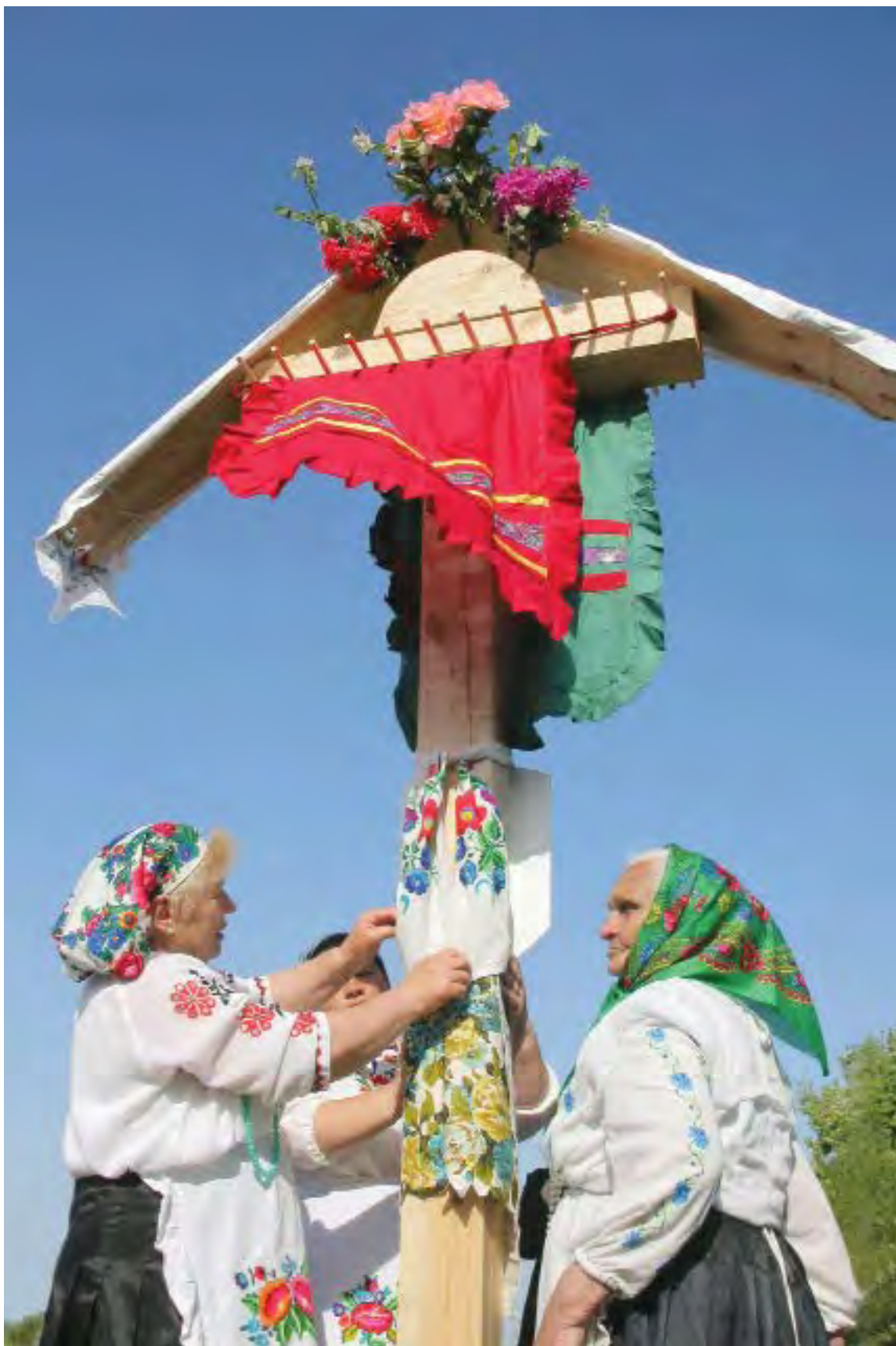
Украшение креста. Adorning of the cross.