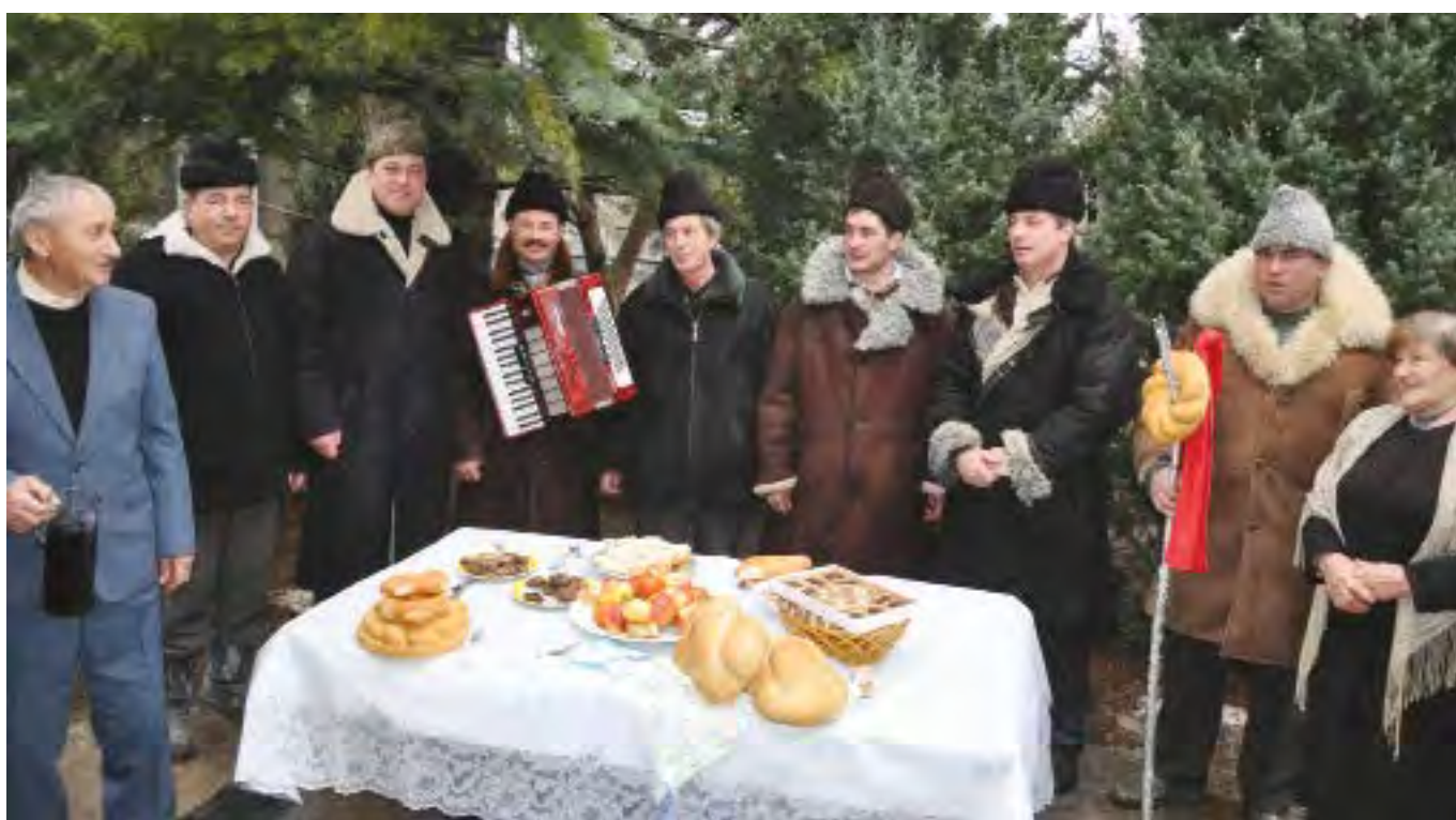
Угощение колядующих. Север Республики Молдова. 2011. Entertainment of the carolling men. The north of Moldova, 2011.