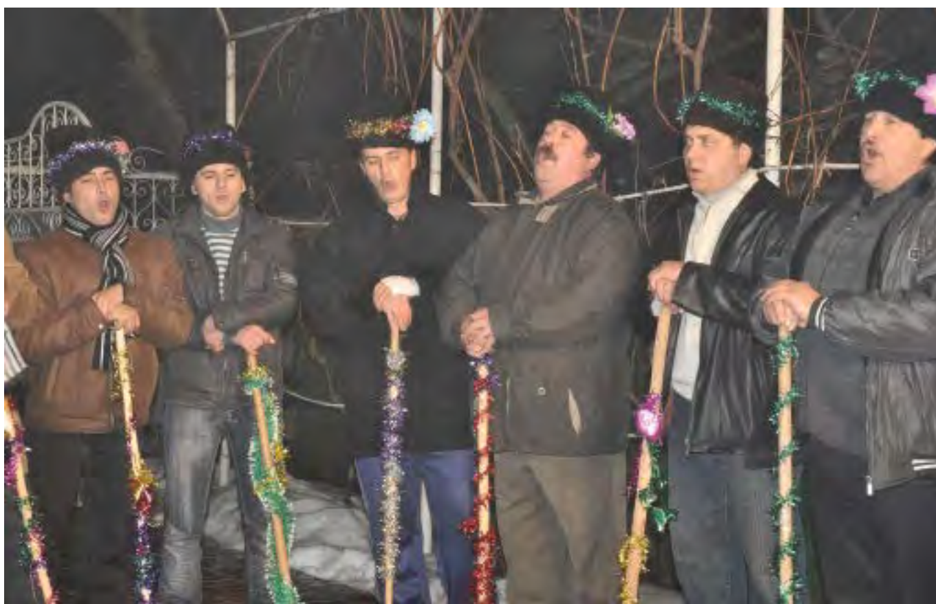
Колядование у окна. Юго-запад Республики Молдова. 24.12.2010. Carolling near the window. The south-west Moldova, 24.12.2010.