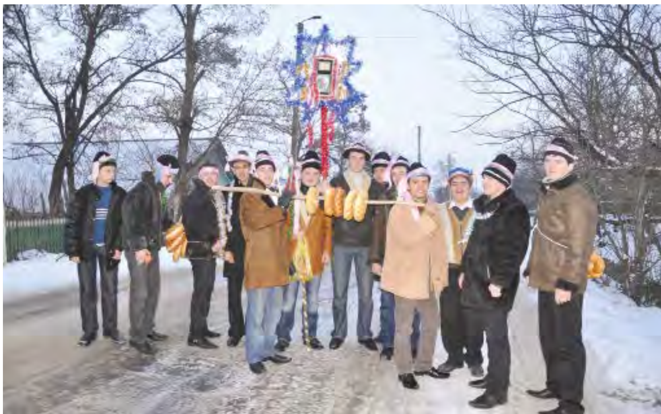
Группа колядующих парней на улицах села Rascaieti. Юго-восток Республики Молдова. 06.01.2011. The group of carolling guys on the streets of the village of Rascaieti. The south-west Moldova, 06.01.2011.

The Republic of Moldova plans to propose, jointly with Romania, in 2012, the registration of this element in the Representative list of ICH of UNESCO. At Christmas, as well as on New Year, groups of researchers went to villages, recorded on video, mode photos and recorded the Carolling in young men band. The completion of the fund of audio recordings continues, and the older ones are processed. The book "Carolling in young men band", Chişinău, 2011 (500 copies) was published with the financial support of the UNESCO Regional Office form Moscow, aiming to present this custom as a candidate for the Representative list of ICH of UNESCO. More than 180 of town halls (regional administration) from 1700 of the existing ones in the Republic, signed the agreement for the further preservation of this custom.