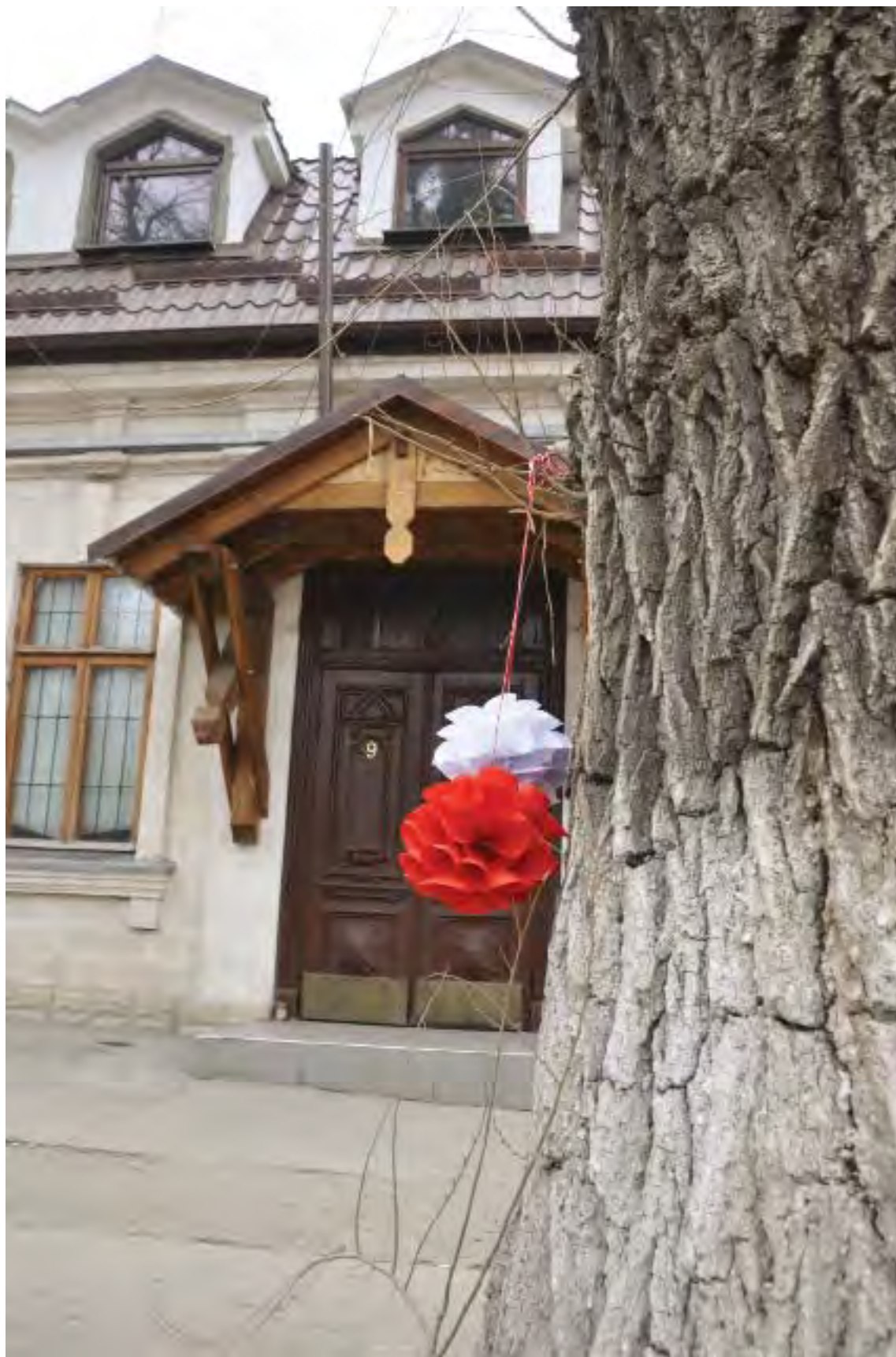
Мэрцишоры для дома. 02.04.2011. Mərzişoruls for the house, 02.04.2011.