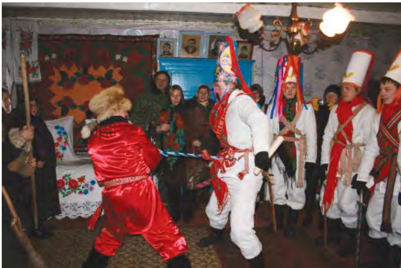
Битва «царей». The battle of "tsars".

семежевских пояса с геометрическим орнаментом; на голову надевается высокая цилиндрическая шапка белого цвета с разноцветными бумажными лентами.