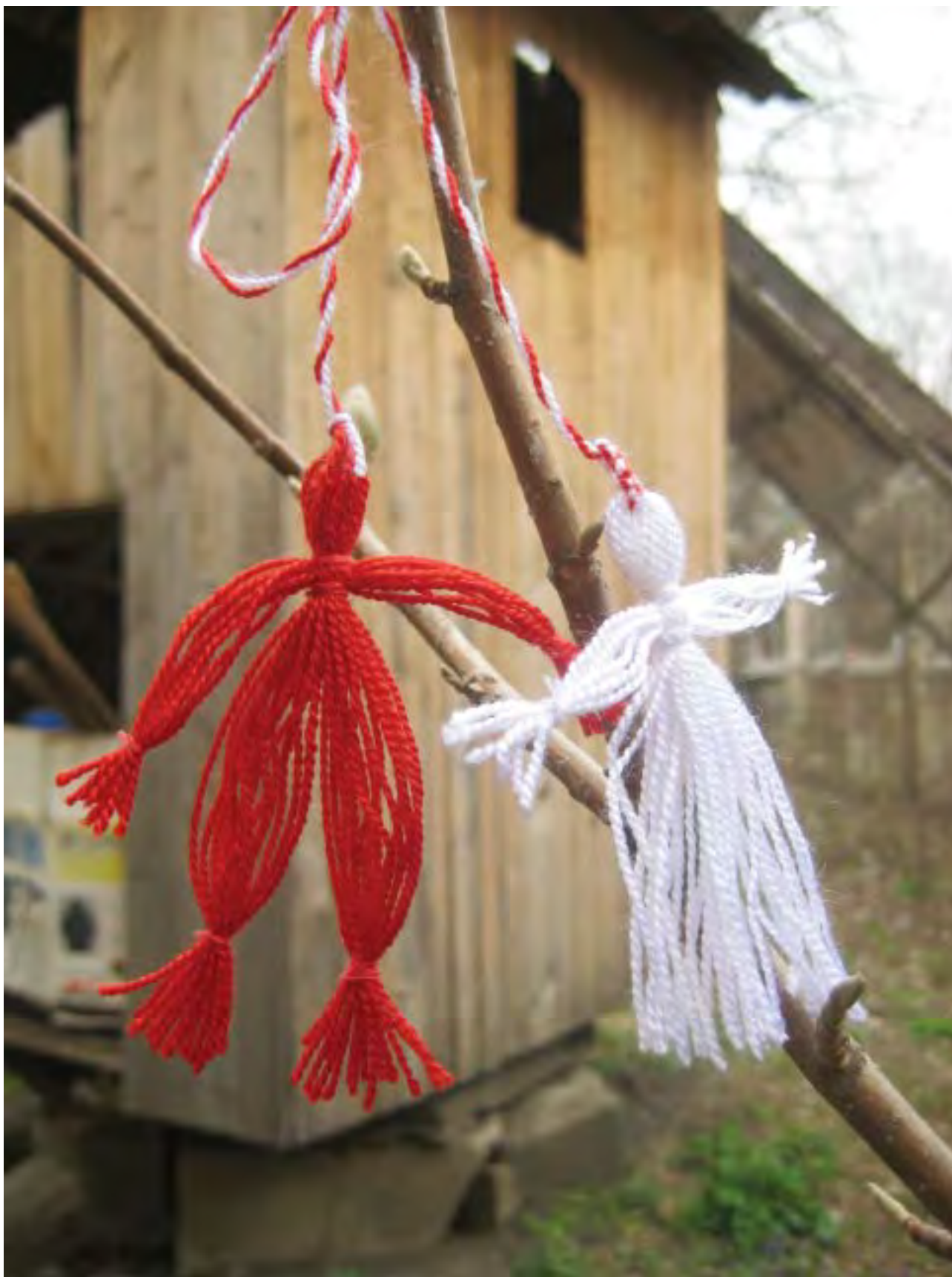
Мэрцишоры на ветках. Апрель 2010. Märzişoruls on the branches . April 2010.