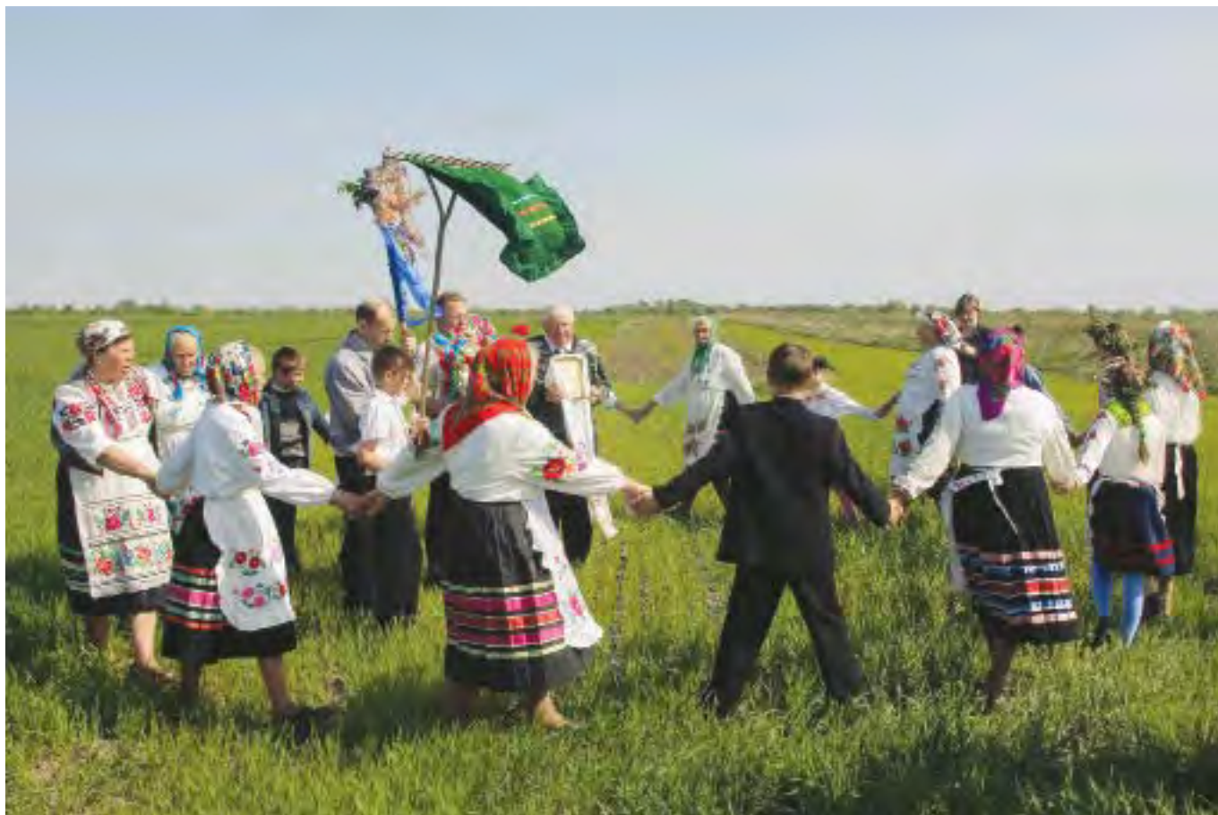
Вождение хоровода на поле. Round dancing on the field.

On the eve of the holiday or on the morning of St. George's Day ritual bread – “карагод” is baked by one of the women. Young girls and old and young women come to her house to decorate the bread with both blossoming twigs and artificial flowers while singing the traditional song “Карагод, карагод, мы цябе наражаем”. Then they go out and form a procession in the following way: first there