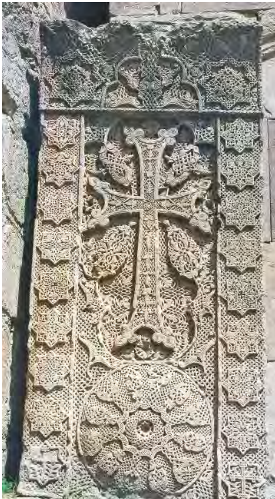
Хачкар, XIII в. Kachkar, XIII c.