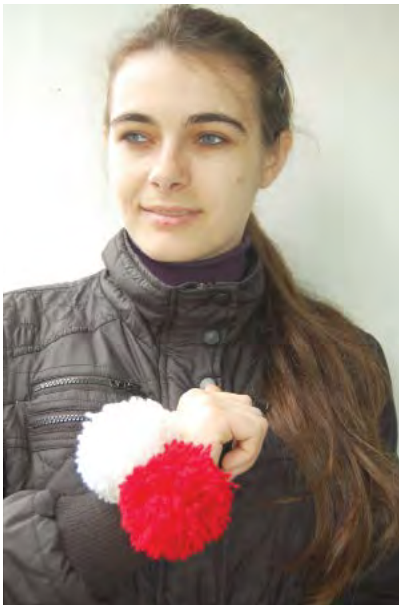
Мэрцишоры завязаны древним способом но увеличены. Mărțișoruls are tied in the ancient way but enlarged.

Слово «мэрцишор» обозначает месяц март и предметный символ специально созданный к празднику. Он чаще всего создается из белой и красной шерстяной нити, скрученной в спиралевидный шнурок. Раньше этот шнурок с кистями или помпончиками завязывали на руки, шею и носили как оберег. Начиная со второй половины XX века, его стали прикреплять к груди, добавляя к концам различные декоративные детали. По традиции женщины и девушки готовят мэрцишоры в канун праздника. А 1 марта все дарят их друг другу, желая здоровья, благополучия и счастья. Учителя, воспитатели, руководители получают в подарок много таких символов. Как правило, мэрцишоры носят весь март. Согласно традиции, бытующей на севере и в центральной части Республики Молдова, расстаются с символом, когда видят первое начинающее цвести плодоносящее дерево. Прикрепляют мэрцишор к его ветви для того,