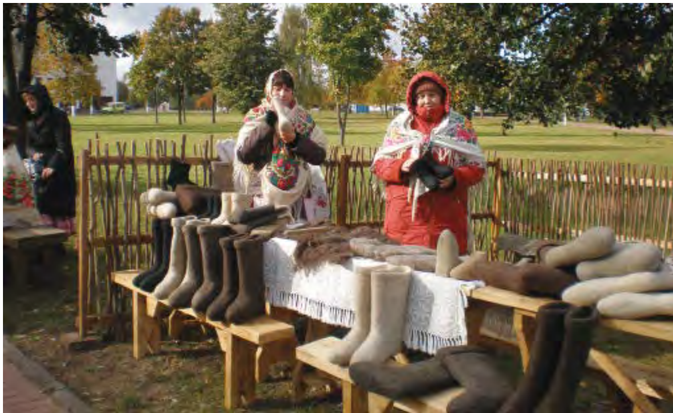
На ярмарке. At the fair.

– мастер расстилает на столе или досках мокрое полотно, на которое раскладывает необходимое количество шерсти, скручивает все это в трубку и начинает катать (валять) по столу. Потом заготовка сверху покрывается необходимым количеством шерсти, снова скручивается с полотном в трубку и катается. Затем вещь кладут на ребристую доску, обливают горячей водой и трут, пока она не сваляется полностью. На последнем этапе сваленное изделие сушат с помощью печи.