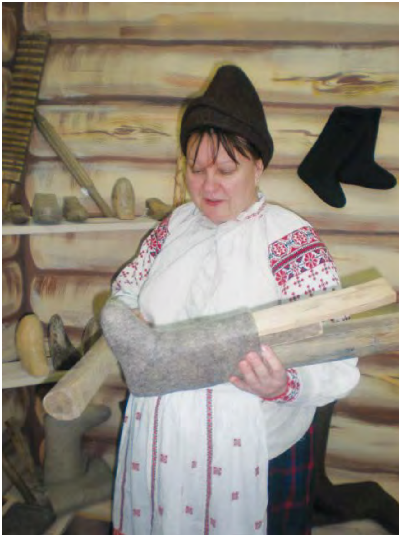
Изготовление валенок. Production of valenki.