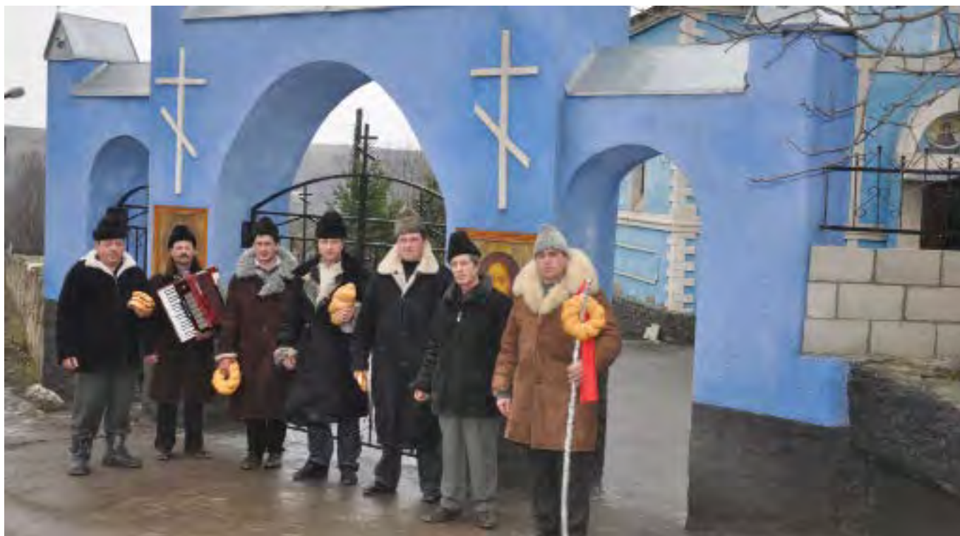
Мужчины колядуют и в церкви. 2011. Men are carolling in the church too, 2011.