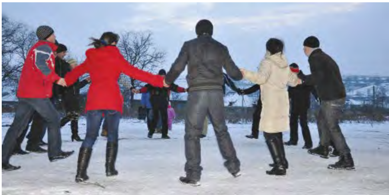
Позже входят в хору и девушки. Садак. 07.01.2011. The girls join the chora. Sadac, 07.01.2011.