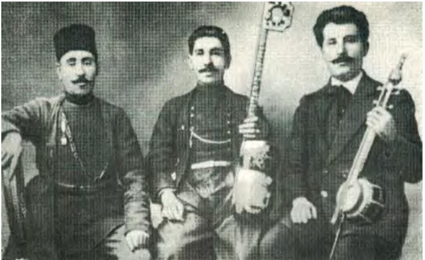
Кечачи оглы 1913 Варшава Kechachi oqlu 1913 Warsaw

The musical term “mugham” has been in use in Azerbaijan, at least, for seven centuries. At present time it is used with regard to a free melodic style of original syntax that reproduces a natural rhythm of emotional human speech. “Mugham” is also a general name of the largest genre of traditional music with a variety of its small and big