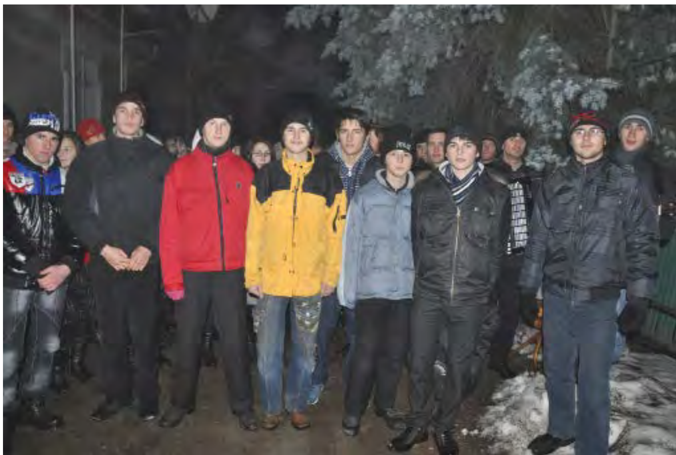
Колядование школьников. Юго-запад Республики Молдова. 24.12.2010. Carolling of schoolboys. The south-west Moldova, 24.12.2010.

The carols (colinde) transmitted in such a way are very old, are original, authentic and very important for understanding the way of life and the values of the traditional society. They can be compared with hymns addressed to the persons who are carolled. According to the tradition, as a sign of respect, the young men band (ceata de bărbați tineri) had to carol all the households from the community. They carol in an organized way, anticipating or remedying the possible conflicts, and, on the second day or on the third day, they organize in the village a Hora/Joc (a