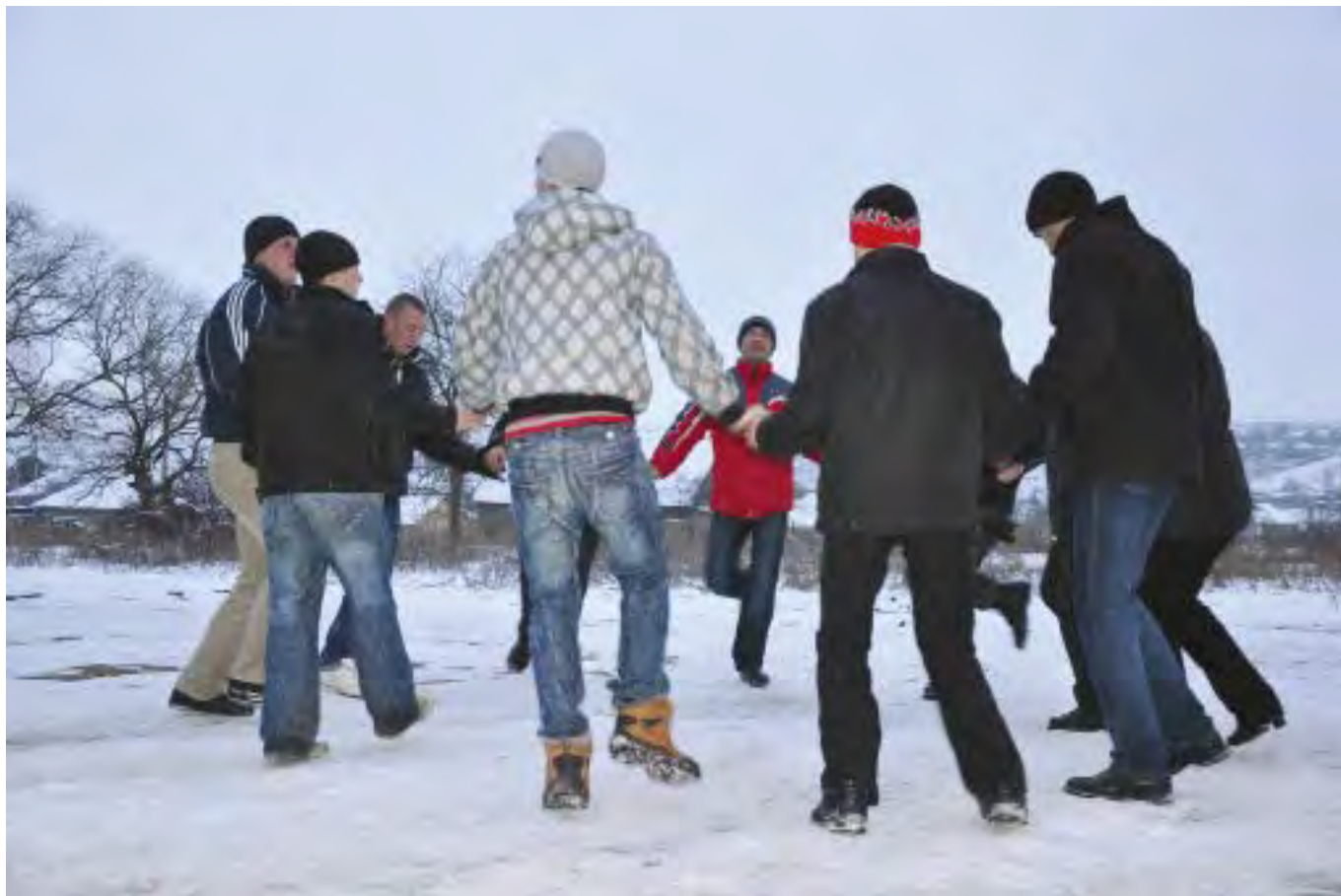
Парни танцуют хору - танец солнца - перед началом колядования. Садак. 07.01.2011. Guys dancing the chora - solar dance - before the beginning of carolling in Sadac, 07.01.2011.

Carolling (Colindatul) is a calendar custom performed most often on Christmas, in many localities, and more rarely on New Year, in a few villages of the Republic of Moldova, as the two parts of a once entire complex. In the first half of the day, children are those who carol. In the evening,