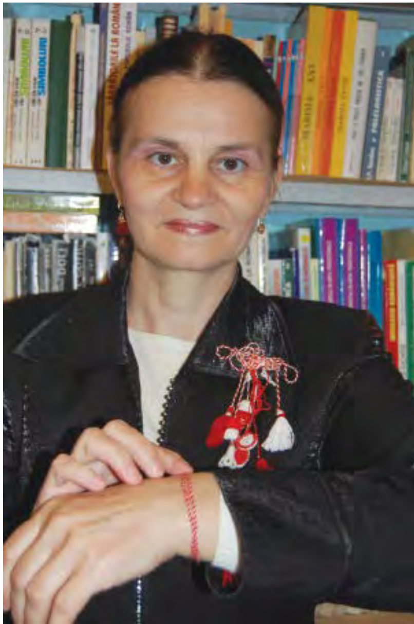
1 Марта все дарят и получают в дар мэрцишоры. Everybody presents and achieves mărțișoruls on March 1st.

Mărțișorul is an ancient custom that marks the passing from winter to summer. In Antiquity, the New Year began on the 1st of March and coincided with the beginning of a new cycle of nature. The celebration of the New Year lasted 9, and later 12 days. After the institution of the new Julian calendar (in 46 BC), the beginning of the year was officially transferred on the 1st of January. A big part of the customs specific for the beginning of the year gradually migrated to the 1st of January, but others remained on the 1st of March, keeping the memory of the old beginning of the year. These customs are connected with the ritual purification and protection of the dwelling, of the household buildings, of people and domestic animals in this season of passage.