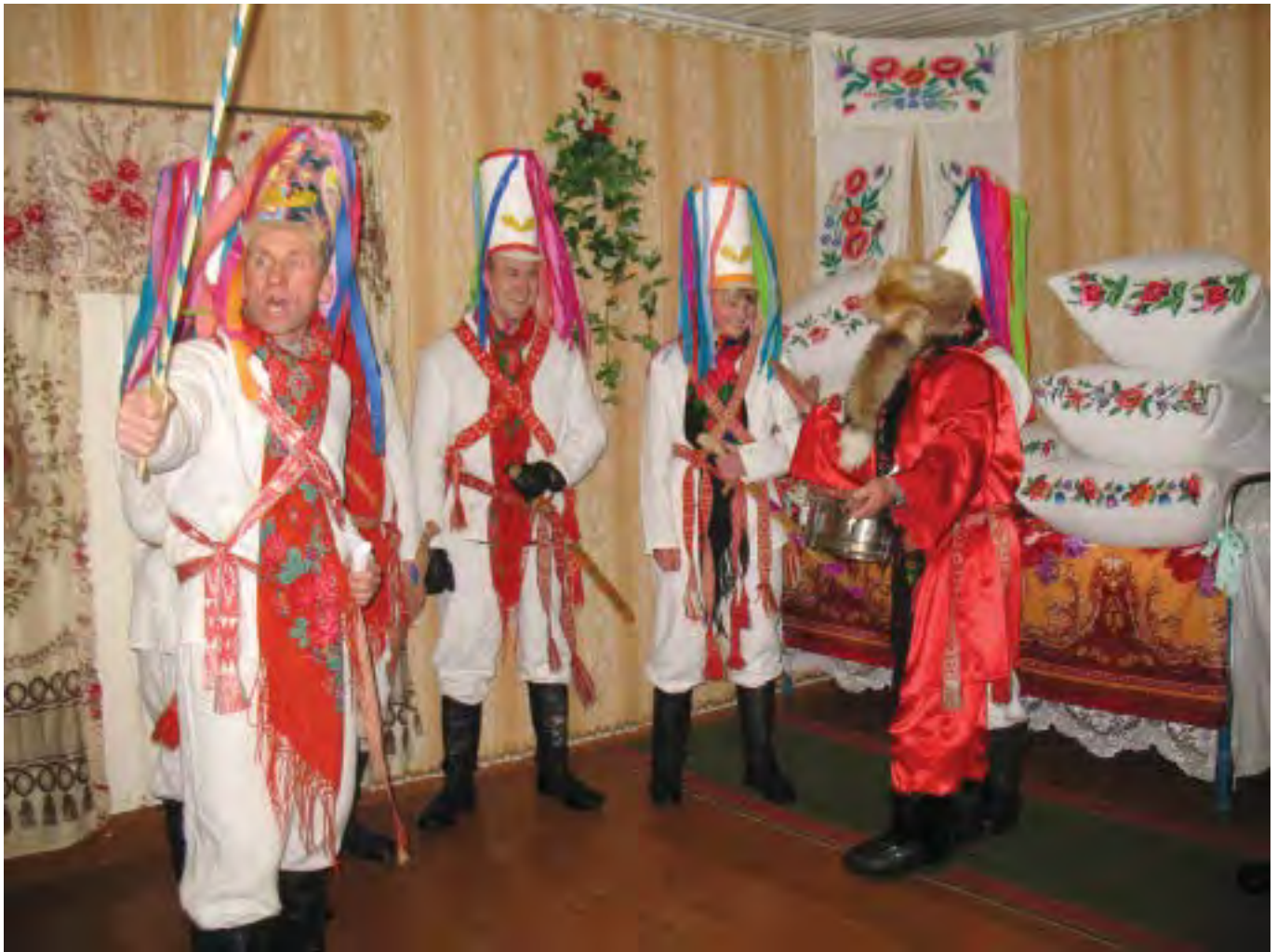
Действие в избе. Action in the izba.

В избе разыгрывают небольшое смешное представление встречи и битвы «царей», во время которого появляется «доктор», «лечащий» «раненых» в битве противников, прописывая им в диалоге смешные рецепты: «А что у тебя болит?», «Сердце!», «Дать ему под нос перца!» и т.д. После представления происходит традиционное поздравление хозяев избы и одаривание участников обхода традиционной едой.