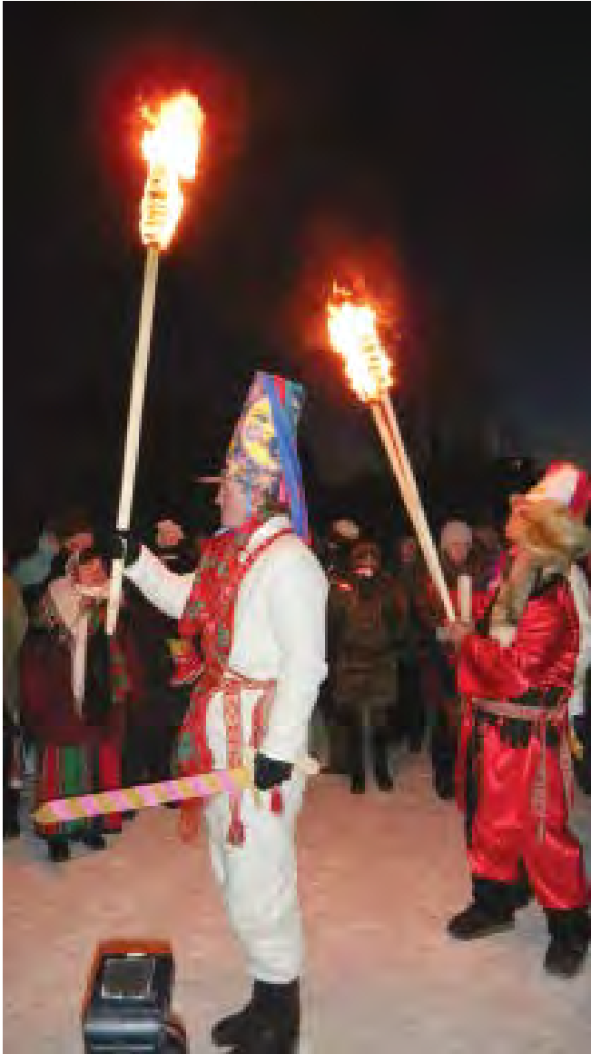
В вечерних сумерках. In the twilight.

средств массовой информации, просто заинтересованных людей, туристов, причем как белорусов, так и иностранцев; поспособствовало развитию обряда и участию в праздничной церемонии большого количества жителей деревни. Кроме того, деревня Семежево в 2010 г. включена в Государственную программу развития малых городов и сел Беларуси, в начале 2011 г. обряд был удостоен специальной премии Президента Республики Беларусь.