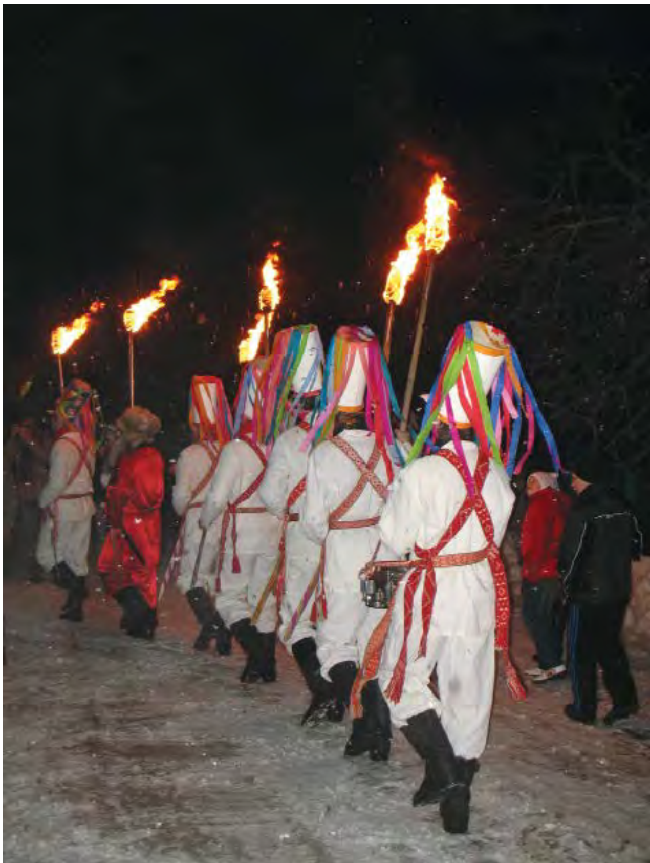
Кольдное шествие. Christmas procession.