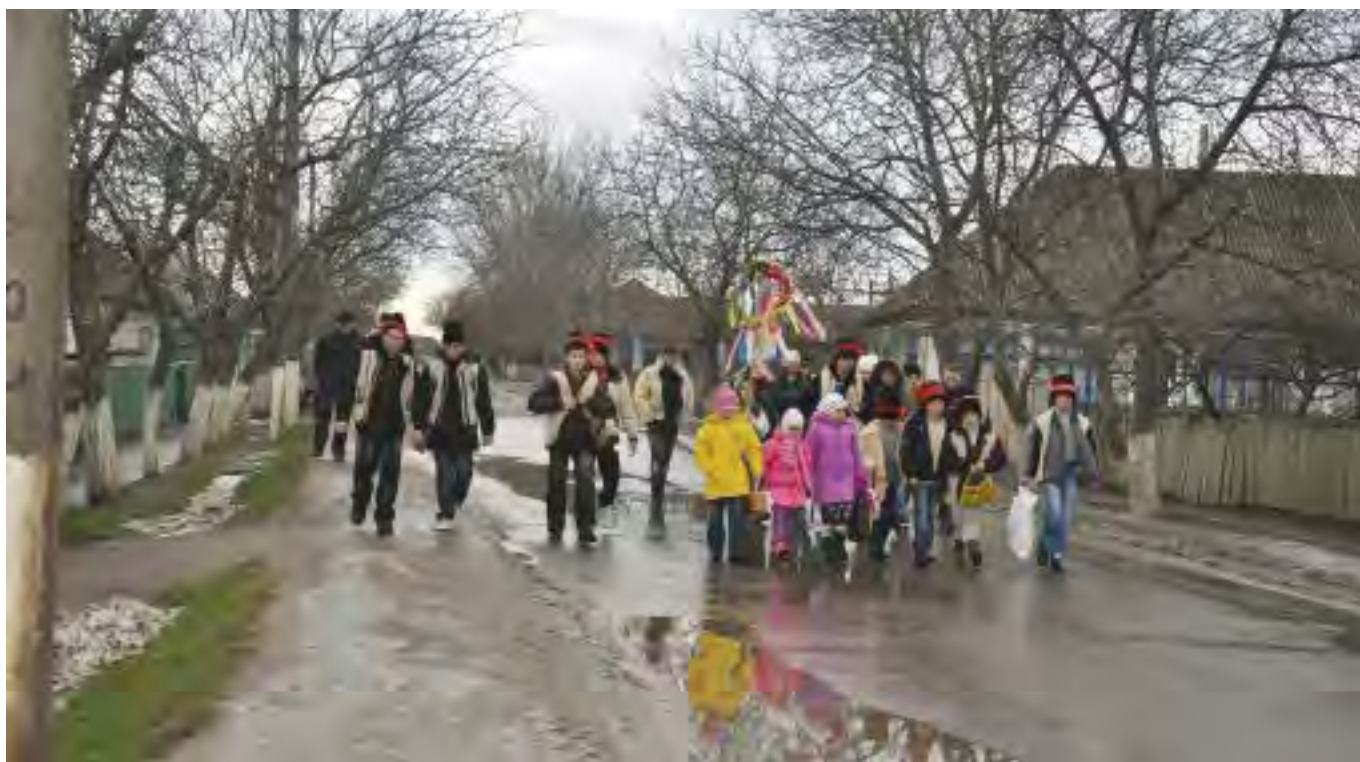
Колядование утром. Юго-запад Республики Молдова. 25.12.2010. Carolling in the morning. The south-west Moldova, 25.12.2010.

The custom Carolling in young men band with its specific deep social aspects is one of reference in the identity strategies of the people of the Republic of Moldova. Carolling in young men band unites the group of lads, cultivates their discipline, teaches them to