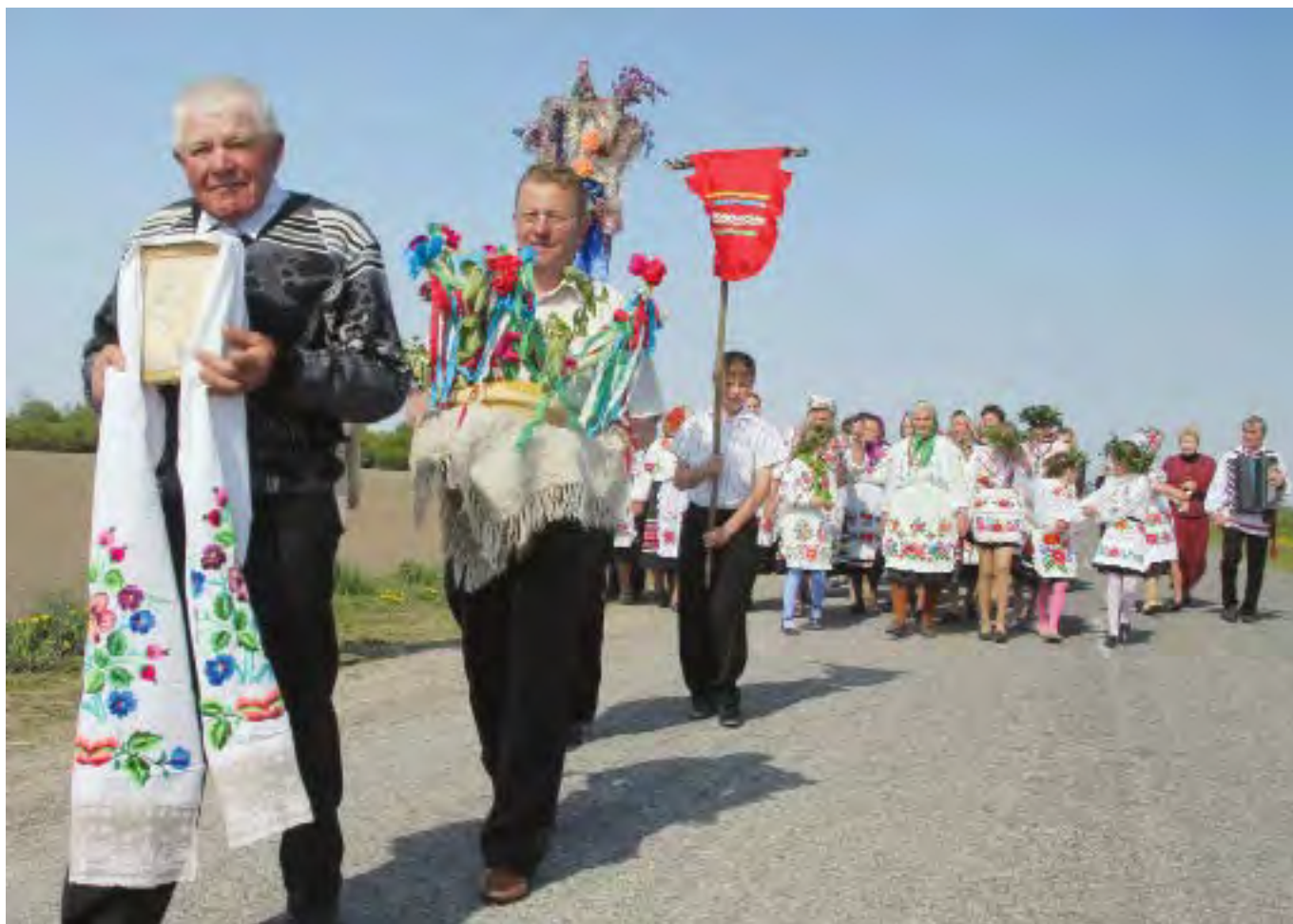
Праздничное шествие. Festive procession.

Потом в избе собираются бабушки, женщины и девушки, чтобы, исполняя традиционную обрядовую песню «Карагод, карагод, мы цябе наражаем», украсить «карагод» цветущими веточками и искусственными цветами. Потом хлеб выносят из избы на улицу, где организуется шествие в определенном порядке — парень с колядной пятиконечной звездой, парень с граблями (на которых висит зеленый фартук), парень с «карагодом», девушки с рушником, парень с иконой, далее — рядами девушки, потом парни, за ними — старшие певцы и другие жители деревни. Процессия с «карагодом» молча движется через всю деревню к церкви.