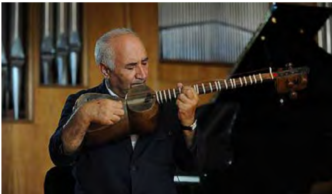
Performance Art of Tar Искусство игры на таре

The Tar is a long-necked plucked lute, practised by numerous individual tar-craftsmen, performers and performing amateurs. Considered by many to be the country's leading musical instrument, it features alone or with other instruments in numerous traditional musical styles. Craftsmanship and performance art of the tar has been practised since Middle Ages but contemporary Azerbaijani practitioners make and perform the tar introduced in early 19th century by an Azerbaijani tar-craftsman Mirza Sadig Asad oglu (Sadiqjan).