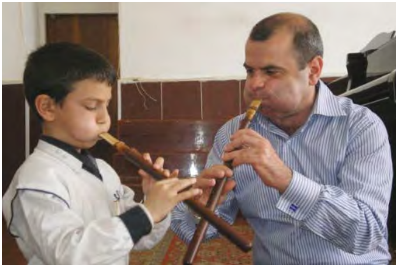
Проект ЮНЕСКО по обучению игре на армянском дудуке. Armenia Duduk Classes Unesco project.

лен для игры любого основного тона, начиная с острого Ф до естественного Б тона. Звук каждого типа имеет определенные различия: например звук, издаваемый из А-дудука больше подходит для любовных песен, а из Д-дудука – для танцев.