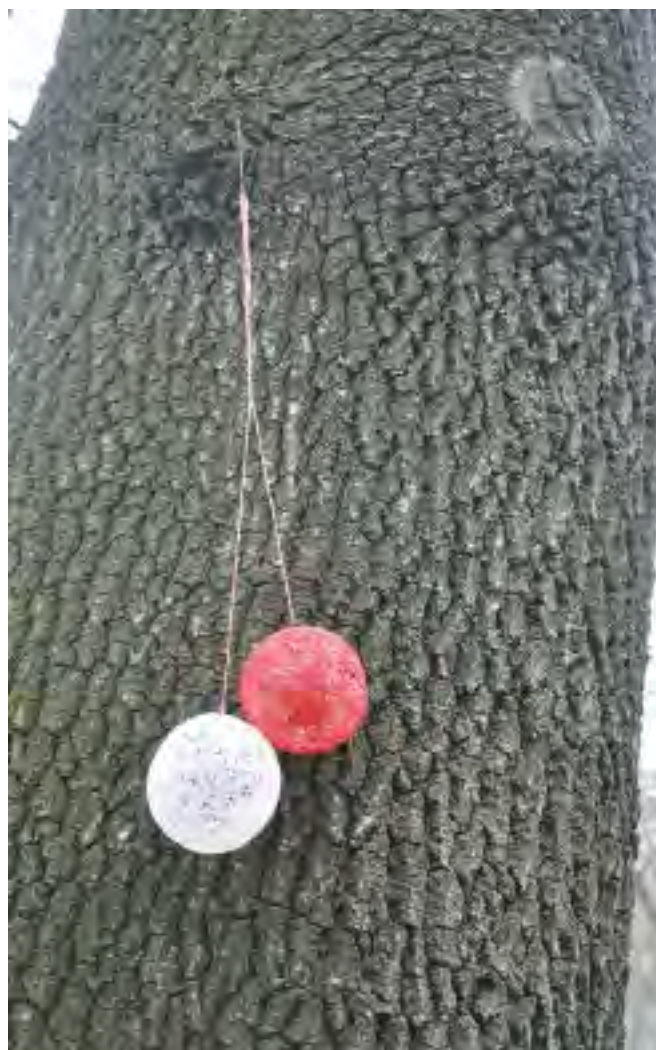
Мэрцишоры вывезенные на улицу. 02.04.2011. Mărtișoruls are hung outdoors, 02.04.2011

Ареал Мэрцишора достаточно велик. Республика Молдова служит границей его бытования в Восточной Европе, а в балканском пространстве праздник от-