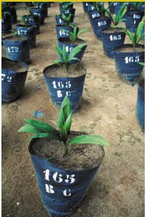
Клон BC165 масличной пальмы, полученный in vitro в питомнике Кот д'Ивуара