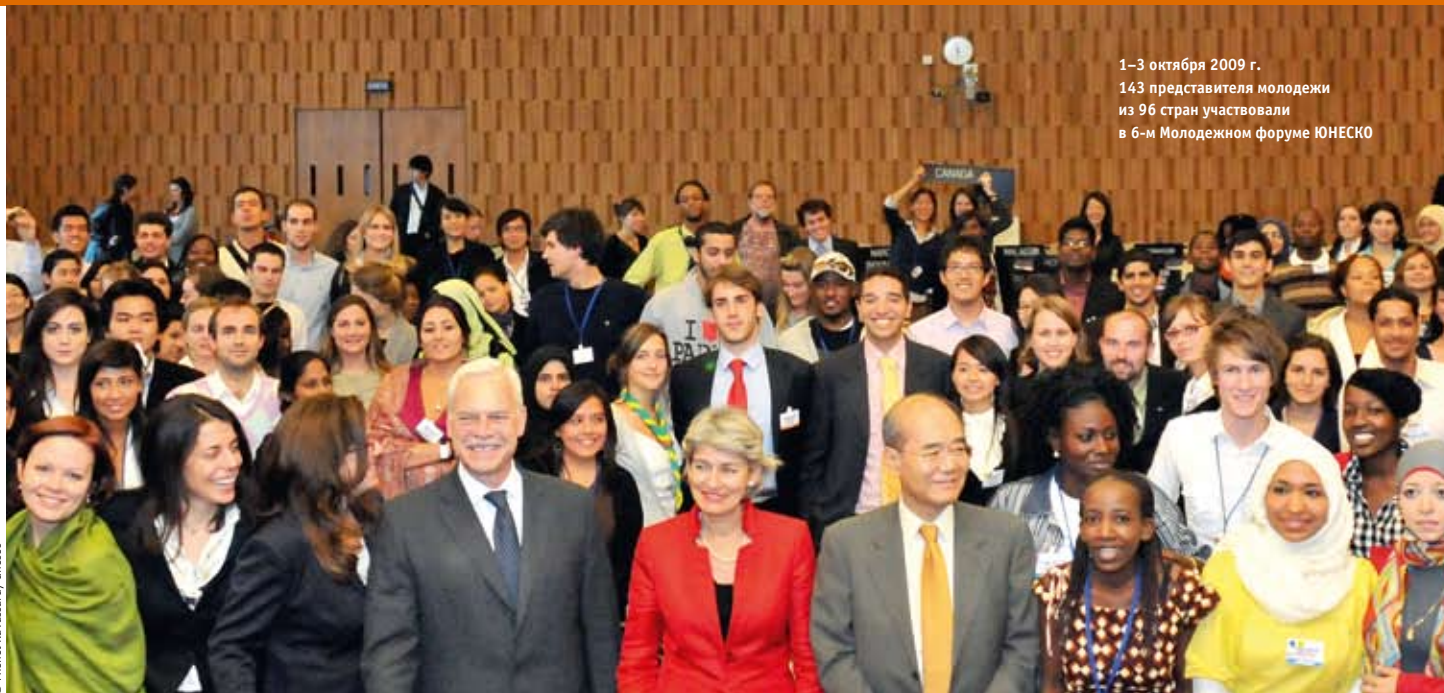
1–3 октября 2009 г. 143 представителя молодежи из 96 стран участвовали в 6-м Молодежном форуме ЮНЕСКО