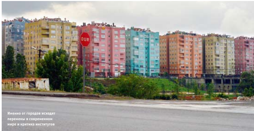
Именно от городов исходят перемены в современном мире и критика институтов