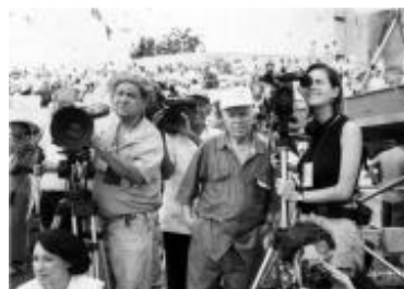
Negativos originales del Noticiero ICAIC Latinoamericano, desde 2009 se incorporó al Registro de Memoria del Mundo de la UNESCO.