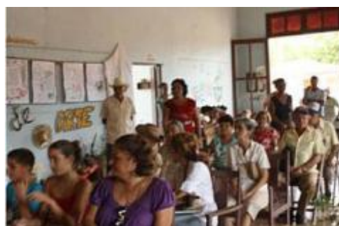
Participantes de la comunidad en el encuentro.

Los Hogares Cucalambé –iniciados en 1993 y que toman su nombre en honor a Juan Cristóbal Nápoles Fajardo, El