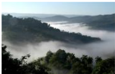
Parque Nacional Alejandro de Humboldt, declarado sitio de Patrimonio Mundial en 2001.