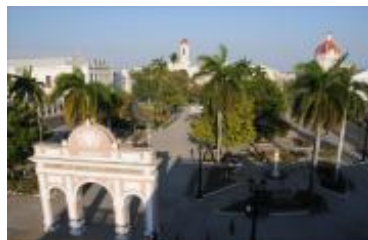
Centro histórico urbano de Cienfuegos, declarado sitio de Patrimonio Mundial en 2005.