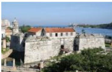
La Habana Vieja y su sistema de fortificaciones cumple 30 años de haber sido declarado sitio de Patrimonio Mundial.