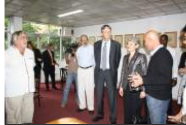
© UNESCO La Habana. El Director de la Escuela Internacional de Cine y Televisión (EICTV) acompañó a la Directora General durante su visita por esta prestigiosa institución.