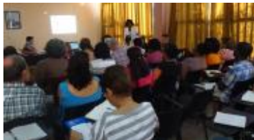
Taller celebrado en La Habana, diciembre de 2012.