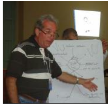
Taller celebrado en Trinidad, noviembre de 2012.