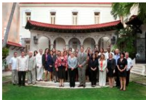
Directora General con todo el personal de la Oficina de la UNESCO en La Habana.