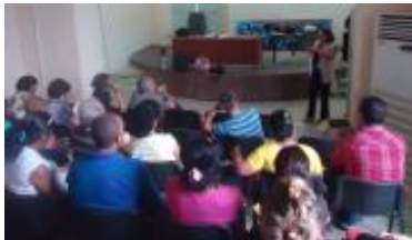
Taller celebrado en Trinidad, noviembre de 2012.