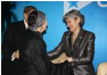
La Directora General felicita a la Prima Ballerina Assoluta Alicia Alonso, Embajadora de Buena Voluntad de la UNESCO, en el acto de entrega del Título Doctora Honoris Causa en Relaciones Internacionales otorgado a esta destacada personalidad.