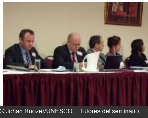
© Johan Roozer/UNESCO. . Tutores del seminario.

Del 3 a 5 de diciembre tuvo lugar en Castries, Santa Lucía, un seminario regional para reforzar la lucha contra el tráfico ilícito de patrimonio cultural en los países del Caribe, financiado por el Fondo de Emergencia de la Directora General de la UNESCO, la Oficina Regional de Cultura para América Latina y el Caribe de la UNESCO y el Ministerio de Educación, Cultura y Ciencia de los Países Bajos.