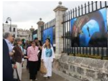
La Directora General inauguró una exposición sobre patrimonio cultural subacuático durante su recorrido por la Habana Vieja, sitio de Patrimonio Mundial.