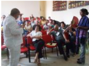
Taller celebrado en Trinidad, noviembre de 2012.