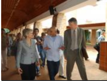
Recorrido por las instalaciones del Instituto Superior de Arte (ISA).