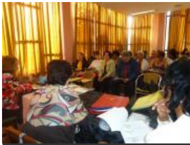
Taller celebrado en La Habana, diciembre de 2012.