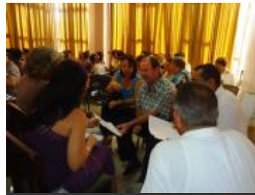
Taller celebrado en La Habana, diciembre de 2012.