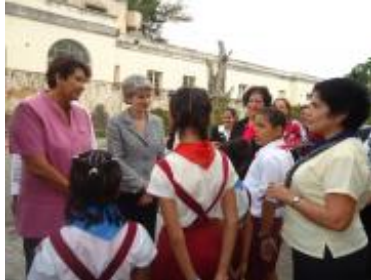
La Directora General, junto a la Ministra de Educación de Cuba, comparten con estudiantes de Ciudad Escolar Libertad.