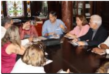
Reunión en la Oficina de la UNESCO en La Habana.