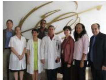
Visita al Laboratorio Antidopaje del Instituto de Medicina Deportiva.