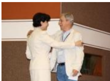
Momento en que Subdirectora General de la UNESCO hace entrega del Premio UNESCO José Martí a Frei Betto.