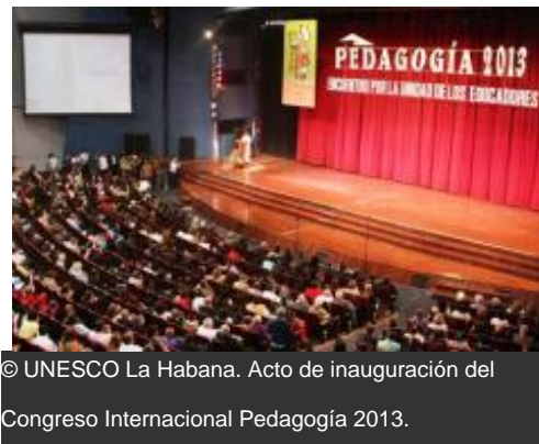
© UNESCO La Habana. Acto de inauguración del Congreso Internacional Pedagogía 2013.

La Oficina de la UNESCO en La Habana tuvo una amplia participación en diversas actividades desarrolladas como parte del programa científico del Congreso Internacional Pedagogía 2013, el evento más importante relativo a la esfera educacional que se realiza en Cuba, celebrado del 4 al 8 de febrero en el Palacio de Convenciones de La Habana con la presencia de unos 4000 delegados provenientes de 40 países.