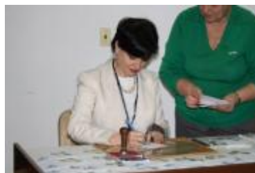
© UNESCO La Habana. Durante la cancelación de la serie postal "José Martí, hombre sincero", en el marco del evento.