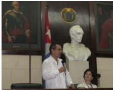
En el Instituto Cubano del Libro, junto a Juan Antonio Fernández, presidente de la Comisión Nacional Cubana de la UNESCO.