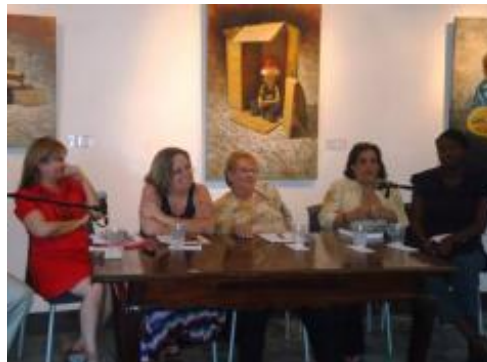
Conversatorio entre profesionales de la radio de varias generaciones.

El Día Mundial de la Radio , proclamado en 2011 por la Conferencia General de la UNESCO para festejar cada 13 de febrero, fue celebrado en Cuba con la realización de diversas acciones organizadas por la Oficina Regional de Cultura para América Latina y el Caribe de la UNESCO (UNESCO La Habana) con el propósito de destacar el poder de este medio de comunicación como plataforma para difundir información, educar, fomentar la diversificación de contenidos y proteger las culturas y lenguas locales.