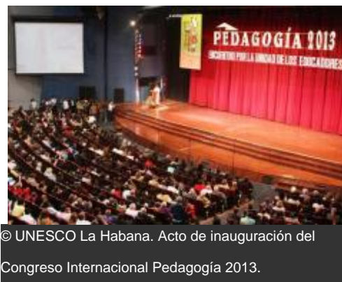
Acto de inauguración del Congreso Internacional Pedagogía 2013.

La Oficina de la UNESCO en La Habana tuvo una amplia participación en diversas actividades desarrolladas como parte del programa científico del Congreso Internacional Pedagogía 2013, el evento más importante relativo a la esfera educacional que se realiza en Cuba, celebrado del 4 al 8 de febrero en el Palacio de Convenciones de La Habana con la presencia de unos 4000 delegados provenientes de 40 países.