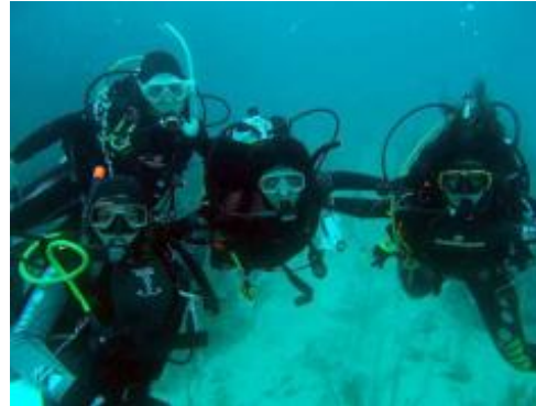
Mujeres buzos participantes en el curso.

Como parte de las actividades a favor de la protección del patrimonio cultural y natural subacuático en Cuba y en la región de América Latina y el Caribe, del 3 al 8 de junio tuvo lugar en Santa María del Mar (La Habana, Cuba) el 7º Curso Internacional de Buceo Científico - CMAS - de la Confederación Mundial de Actividades Subacuáticas Zona América, organizado por la Federación Mexicana de Actividades Subacuáticas y la Federación Cubana de Actividades Subacuáticas (FMAS-FCAS), bajo el auspicio de la UNESCO.