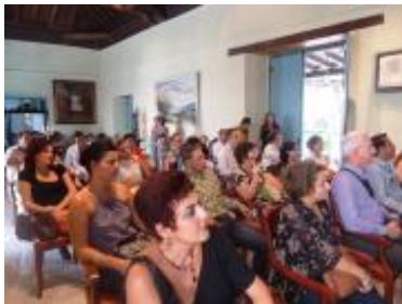
Cursaron el diplomado 39 profesionales de la comunicación procedentes de siete países latinoamericanos.