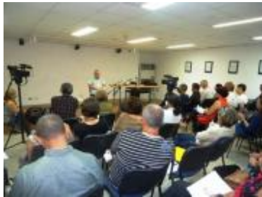
Conferencia magistral de Eusebio Leal, Historiador de la Ciudad.