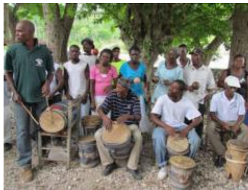
© Alexis Guetichine. Visita a Camp Perrin.

Como parte de las actividades de capacitación organizadas por la Oficina Regional de Cultura para América Latina y el Caribe , con sede en La Habana, y la Oficina de la UNESCO en Puerto Príncipe, en colaboración con la sección de Patrimonio Cultural Inmaterial de la UNESCO, concluyeron satisfactoriamente dos talleres de capacitación sobre la implementación de la Convención de la UNESCO para la Salvaguardia del Patrimonio Cultural Inmaterial (2003) en los departamentos del Sur y del Norte de Haití, respectivamente.