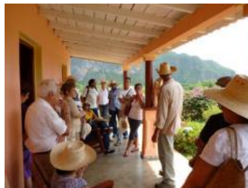
Sesión de trabajo en el Valle de Viñales, sitio del Patrimonio Mundial.