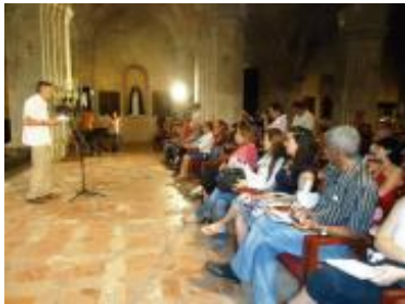
Momento del discurso del Director de UNESCO La Habana en el acto inaugural del Diplomado.