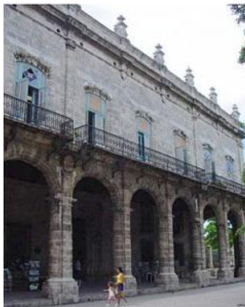
Palacio del Segundo Cabo, edificio sometido en la actualidad a un proceso de restauración capital.

Iniciado en 1995, el Encuentro Internacional sobre Manejo y Gestión de Centros Históricos cuenta con el apoyo de la UNESCO para su difusión internacional. En esta edición del evento el tema central fue "El derecho ciudadano a los hitos urbanos: grandes estructuras antiguas en función de nuevas centralidades".