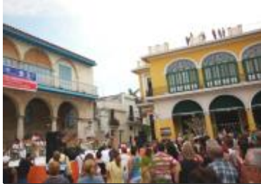
Muestra panorámica del espectáculo.