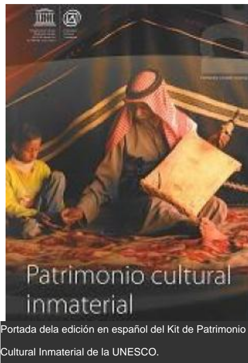
Portada de la edición en español del Kit de Patrimonio Cultural Inmaterial de la UNESCO.

Elaborado por la Sección de Patrimonio Cultural Inmaterial de la UNESCO, el Kit consta de seis folletos que abordan los siguientes temas: ¿Qué es el Patrimonio Cultural Inmaterial? ; Los ámbitos del Patrimonio Cultural Inmaterial ; Convención para la Salvaguardia del Patrimonio Cultural Inmaterial ; Identificar e inventariar el Patrimonio Cultural Inmaterial ; Aplicación de la Convención para la Salvaguardia del Patrimonio Cultural Inmaterial ; y Preguntas y Respuestas . Contiene asimismo fichas informativas sobre expresiones del Patrimonio Cultural Inmaterial de América Latina y el Caribe incluidas en la Lista Representativa de la UNESCO.