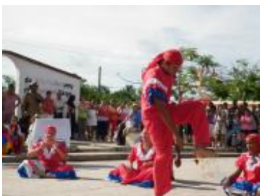
Función en la plaza pública de Cueto en la que se presentaron danzas de origen haitiano y performances de come-candelas.