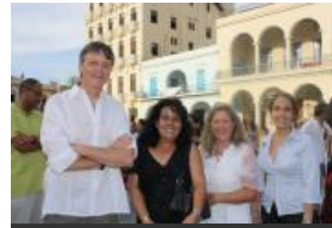
© UNESCO La Habana. El Director, junto a tres colegas de la Oficina, disfrutando del espectáculo.