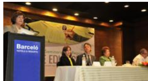
Momento de las palabras de saludo de la ministra Pimentel a los participantes en el evento.

Con la presencia de más de 350 académicos y especialistas en la temática educativa procedentes de Aruba, Costa Rica, Cuba, Estados Unidos y República Dominicana, sesionó el 3er. Seminario Subregional de Educación “Factores que favorecen la calidad de una educación inclusiva”, del 4 al 6 de mayo en el Hotel Barceló Santo Domingo, en República Dominicana.