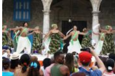
Una de las coreografías protagonizadas por el Conjunto Folklórico Nacional.