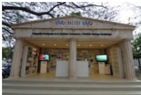
Vista panorámica del stand.

En el stand de la Organización se ofrecieron conferencias, talleres y otras actividades relacionadas con el libro y la literatura como parte de la programación oficial de la Feria.