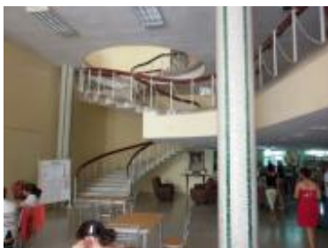
Vista general del interior de la Biblioteca Provincial Alex Urquiola.