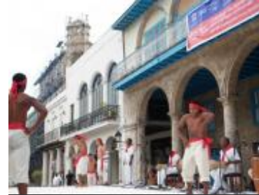
© UNESCO La Habana. El Conjunto Folklórico Nacional da muestras de talento y versatilidad.