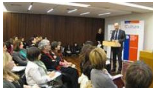
© UNESCO Santiago / C.Jerez. Intervención de Brugman en el Seminario.

Con una amplia participación de la sociedad civil tuvo lugar los días 26 y 27 de mayo el Seminario Internacional de Patrimonio Inmaterial: Patrimonio Cultural, nuestra memoria, nuestra responsabilidad, en el Centro Cultural Gabriela Mistral de Santiago de Chile, evento organizado por el Consejo Nacional de la Cultura y las Artes de Chile (CNCA), el Centro Regional para la Salvaguardia del Patrimonio Cultural Inmaterial de América Latina (CRESPIAL) y la Oficina Regional de Educación para América Latina y el Caribe (OREALC/UNESCO Santiago).