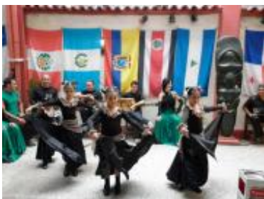
Función en la Casa de Iberoamérica, institución cultural de gran actividad en la provincia.