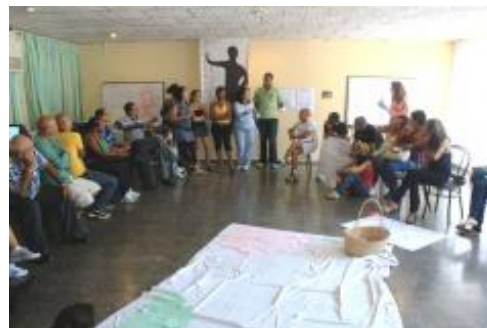
Momento del Taller

La Red Regional SIDACULT, principal estrategia de la Oficina de la UNESCO en La Habana desde donde se dinamizan y exploran las nuevas respuestas culturales, artísticas y sociales que en Latinoamérica y el Caribe se están generando relativas a la epidemia del VIH y Sida, ha ejecutado importantes actividades en las últimas semanas y prevee asimismo el desarrollo de relevantes acciones en los meses venideros.