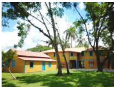
Birán, poblado del municipio Mayarí que se distingue por poseer instalaciones representativas de las arquitectura vernácula en madera.