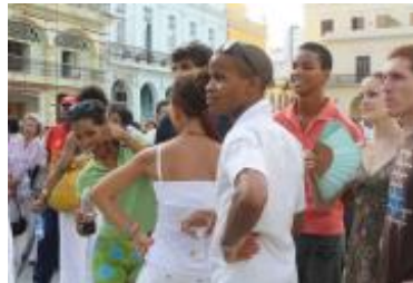
Jóvenes asistentes al espectáculo.