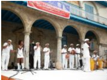
La Compañía Yoruba Andabo llevó el espíritu de la rumba más auténtica a la Plaza Vieja.