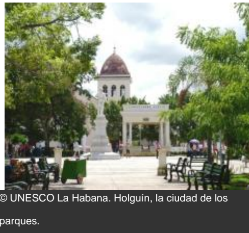
Holguín, la ciudad de los parques.

El proyecto Reactivación de instalaciones culturales en Cuba –que parte de la colaboración de la Oficina Regional de Cultura para América Latina y el Caribe de la UNESCO con el Ministerio de Cultura de Cuba, y se desarrolla gracias al aporte financiero del Reino de Noruega—, apoya la recuperación de equipamientos culturales pertenecientes a diversos municipios de varias provincias del país que fueron afectadas por el paso de dos devastadores huracanes en 2008. Las casas de cultura, museos, cines y bibliotecas beneficiarias del proyecto fueron seleccionadas por el Gobierno de Cuba entre 285 instalaciones reportadas como dañadas por estos eventos climatológicos a lo largo del país.