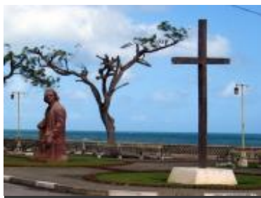
Estatua del Almirante Cristóbal Colón da la bienvenida a la ciudad.