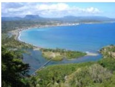
Baracoa, primada de Cuba.