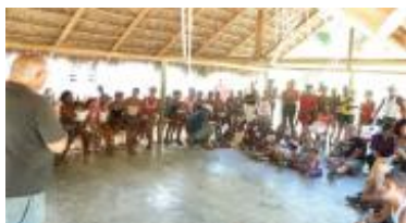
Una de las actividades realizadas con la comunidad.