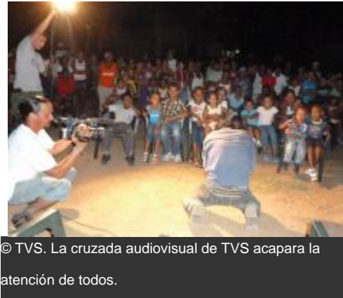
La cruzada audiovisual de TVS acapara la atención de todos.

Desde el 20 de julio un grupo de realizadores de Televisión Serrana (TVS), proyecto comunitario nacido en 1993 bajo el auspicio de la UNESCO y la asistencia financiera del Programa Internacional para el Desarrollo de la Comunicación (PIDC), abandonaron su sede en el municipio granmense de Buey Arriba para emprender durante cuatro semanas una nueva cruzada audiovisual por comunidades rurales en las montañas de la Sierra Maestra, en el oriente de Cuba.