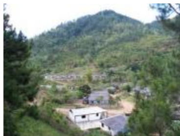
La Alcarraza, una de las comunidades de Guamá a donde llegó la cruzada.