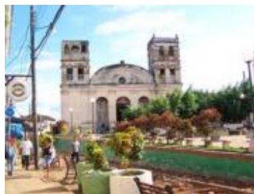
Parroquia "Nuestra Señora de La Asunción de Baracoa", que atesora "La Santa Cruz de la Parra", plantada por Cristóbal Colón en Cuba en 1492 y la única que se conserva de las 29 cruces que el Almirante colocara en sus cuatro viajes por América.