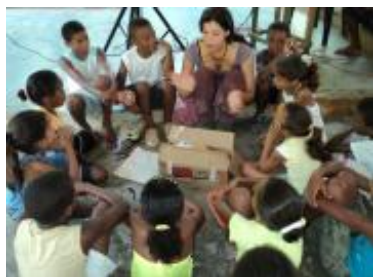
Los niños son protagonistas principales de esta iniciativa.

campesinos de las zonas montañosas más orientales de Cuba, posibilitando a la vez el rescate cultural de estas comunidades rurales de difícil acceso así como su integración a la vida social del país mediante el fortalecimiento de la capacidad comunitaria para transformar su propia realidad. Desde su fundación el 15 de enero de 1993 a partir de la idea del destacado documentalista y cineasta cubano Daniel Diez de formar un grupo de realización audiovisual en la Sierra Maestra, Televisión Serrana ha contado además con la colaboración del Instituto Cubano de Radio y Televisión (ICRT), la Comisión Nacional Cubana de la UNESCO (CNCU) y la ONG Asociación Nacional de Agricultores Pequeños (ANAP). Desde entonces más de 500 documentales, videos y cortometrajes han sido realizados hasta la fecha por esta televisora comunitaria, siendo muchos de ellos merecedores de relevantes premios y reconocimientos a nivel nacional e internacional.