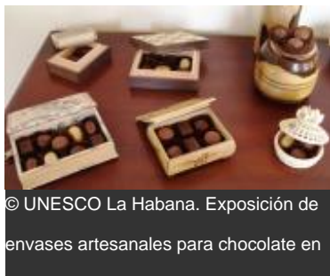
Exposición de envases artesanales para chocolate en la sede del Fondo Cubano de Bienes Culturales de Baracoa.