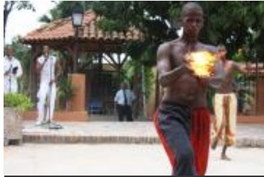
Otro momento de la actividad ofrecida en el Museo Histórico de Guanabacoa.