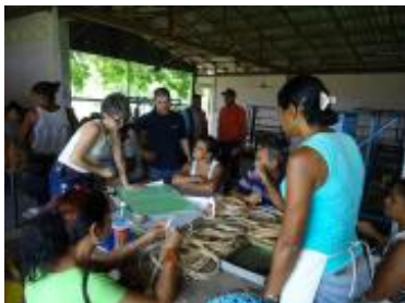
Sesión de trabajo en el taller de Río Cauto.