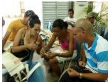
Sesión del taller celebrado en el Jardín Botánico Nacional de Cuba.