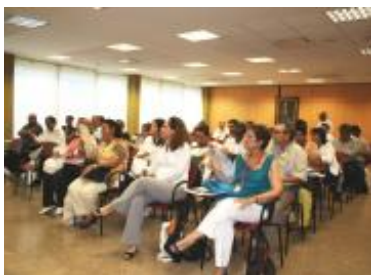
Participantes en la sesión inaugural del taller.