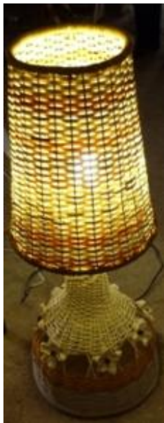
Muestra de un producto elaborado en el taller celebrado en Itabo, Yaguajay.