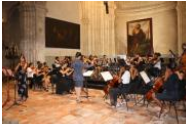
Los estudiantes del Conservatorio "Guillermo Tomás" ofrecieron un concierto memorable en el marco del evento.