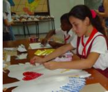
Los niños de la Escuela Especial "René Vilches" crean maravillosas piezas de papel con recortería de diversos materiales y, sobre todo, gran ingenio y dedicación.