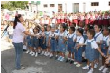
Actividad cultural celebrada en la Escuela Primaria "Domingo Murillo", en conmemoración de la Semana de Acción Mundial de 2012, dedicada a la primera infancia.