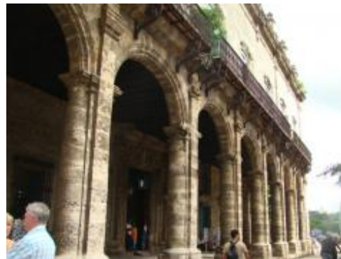
Fachada del Palacio del Segundo Cabo.

El Comité Gestor del proyecto “Rescate Patrimonial y Desarrollo Cultural en La Habana: Palacio del Segundo Cabo”, implementado por la Oficina del Historiador de La Habana (OHCH) en colaboración con la UNESCO y financiado por la Unión Europea, se reunió el jueves 15 de marzo en la Oficina de la UNESCO en La Habana con el fin de analizar el desarrollo del recién finalizado segundo año de implementación del proyecto y reflexionar sobre los pasos a dar durante los próximos doce meses.