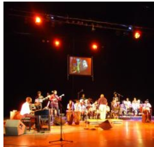
Momento del concierto que ofrecieran destacados jazzistas cubanos en el teatro Mella de La Habana.

Entre las acciones desarrolladas en Cuba con motivo de la celebración pueden destacarse la realización de una conferencia de prensa, la distribución de un cartel promocional y la presentación de anuncios en la televisión y la radio nacionales. El 27 de abril el espacio "Los Jardines del Mella" acogió una jam session donde participaron proyectos de jazz y figuras invitadas, al tiempo que 28 jóvenes músicos premiados en diferentes ediciones del Festival JoJazz protagonizaron la "Descarga A Buena Hora" del centro cultural La Zorra y el Cuervo. Con un concierto especial en el teatro