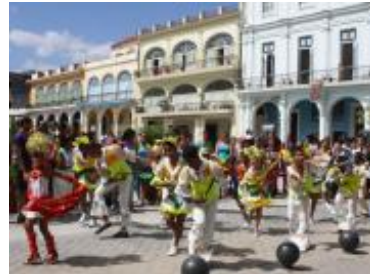
Gala cultural que ofrecieron las escuelas asociadas a la UNESCO que radican en la Habana Vieja, sitio de Patrimonio Mundial.