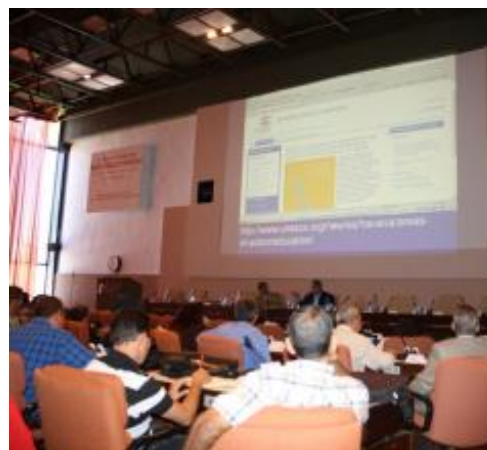
Presentación de publicaciones de UNESCO La Habana en el marco del evento.

En el marco del evento también fueron mostrados por ambos especialistas relevantes resultados del proyecto "Prevención de riesgos y educación en situaciones de emergencia por causas de fenómenos naturales en las islas