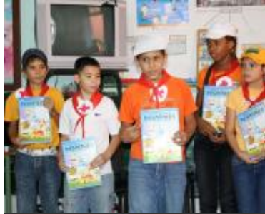
Niños de la Escuela Primaria "Ángela Landa" explican proyecto sobre prevención de desastres en el que participan.