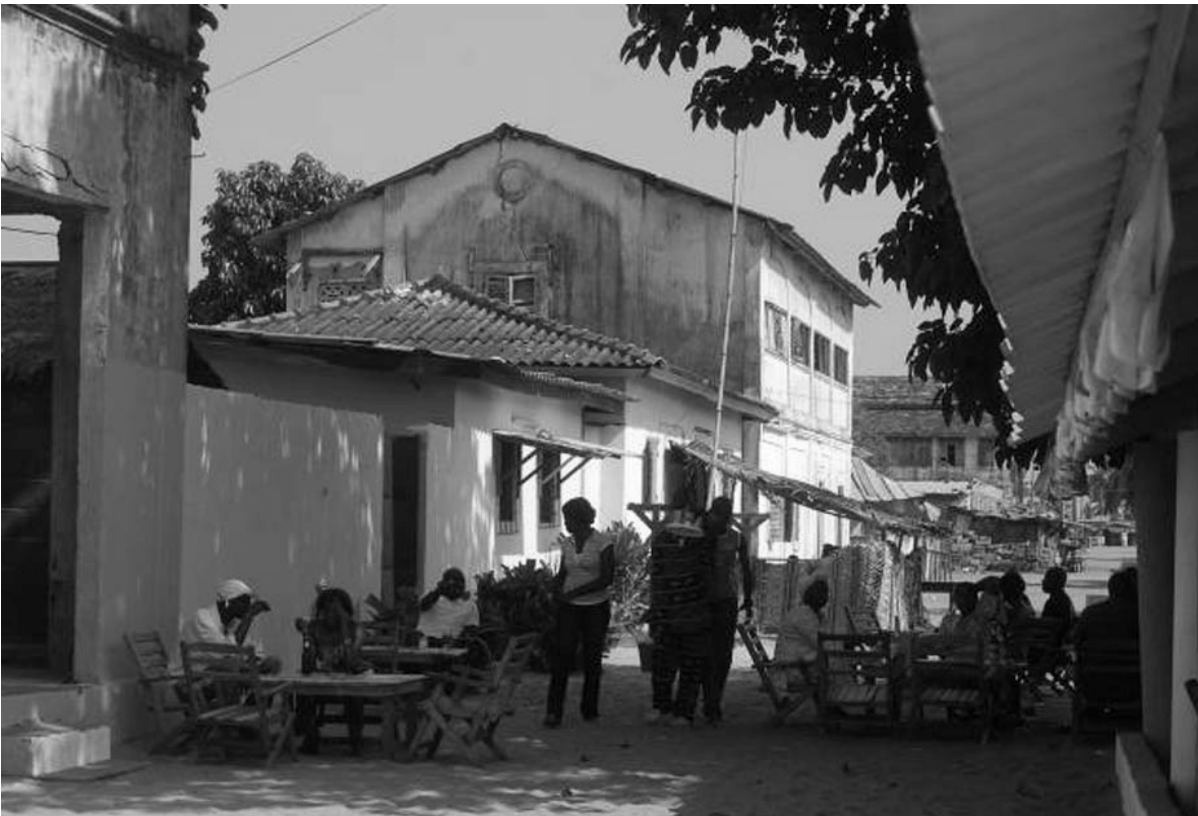
The commercial quarter