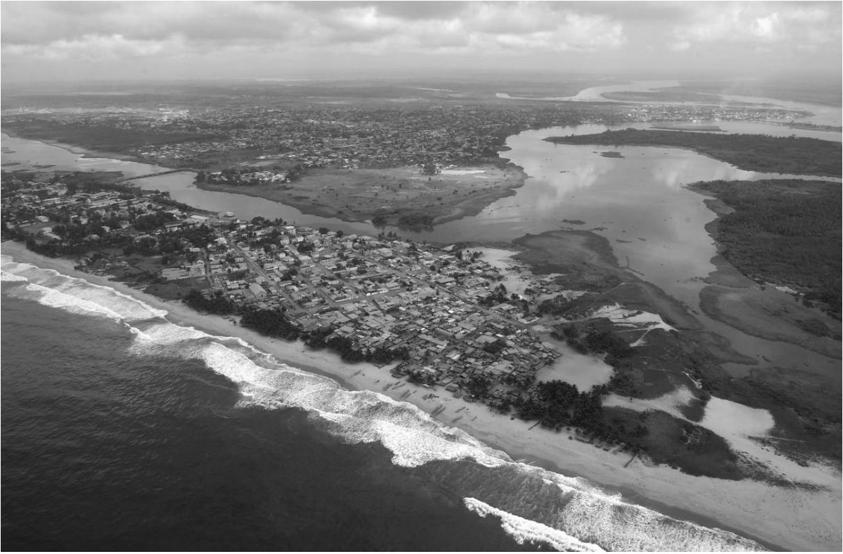
View of the coastal barrier