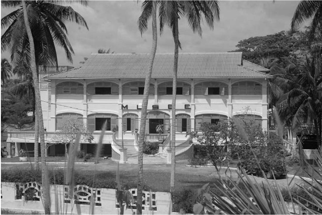
The former Governor's Palace, which is today the National Costume Museum