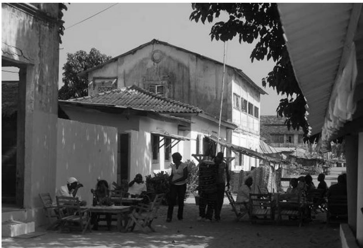
La zone commerciale