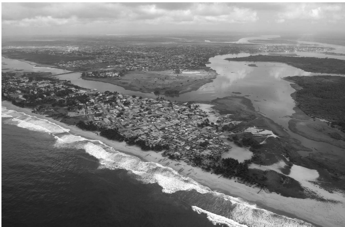
Vue du cordon littoral