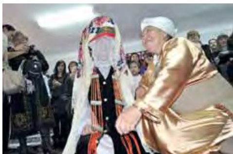
↑ «Хранительницы», проект по развитию музеев Центральной Азии «MUSEUMstan», Казахстан.