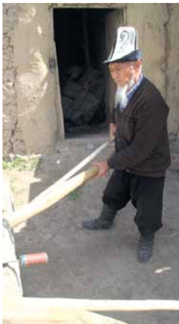
↑ Образовательная программа «Красота в гармонии с природой», КНМИИ им. Г. Айтиева, Кыргызстан. ↑ Educational program "Roll, roll!", the G Aitiev Kyrgyz National Museum of Fine Arts, Kyrgyzstan.

ной поддержки их сотрудничества с системой образования, то в Молдове и в Украине партнерство с образовательными учреждениями музеи устанавливают и поддерживают в основном по собственной инициативе. С одной стороны, ушли в прошлое директивные методы управления музейным учебным процессом и идеологизация его содержания, с другой – отсутствие четкой координации действий между системой образования и музеем не позволяет в полной мере реализовать потенциал последнего в этой области и затрудняет осуществление образовательных проектов (например, ввиду того, что посещать музей школьные группы могут только после уроков или в выходные дни). В ряде случаев поддержка сотрудничества музеев с учебными заведениями ограничивается распоряжениями местных управлений и министерств культуры о днях открытых дверей на 1 сентября (День знаний) или днях бесплатного входа для школьников и студентов (например, еженедельно – в музеях Киева).