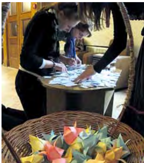
↑ Интерактивное музейное занятие «В поисках папоротник-цветка», Государственный литературный музей Янки Купалы, Беларусь.