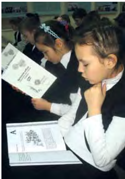
↑ Образовательный проект «Бронзовая азбука», Лисаковский музей истории и культуры Верхнего Притоболья, Казахстан. ↑ Educational project "Bronze ABC", Lisakovsk Museum of History and Culture of the Upper Tobol, Kazakhstan.

→ повышению квалификации сотрудников музеев в области управления музеями и сохранения культурного наследия, в первую очередь на базе учебных пособий и публикаций ЮНЕСКО и ИКОМ.