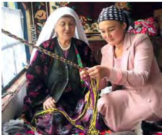
↑ Образовательная программа «Красота в гармонии с природой», КНМИИ им. Г. Айтиева, Кыргызстан. ↑ Educational program "Roll, roll!", the G.Aitiev Kyrgyz National Museum of Fine Arts, Kyrgyzstan.

программ неизменно увеличивает притягательность музея, однако для их разработки, также как и для разработки программ для детских групп (особенно дошкольного возраста), в музеях не всегда имеются подготовленные специалисты.