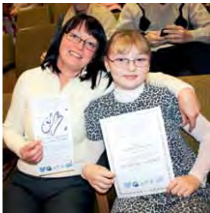
↑ Семейное путешествие «Музейные прятки» – проект, объединивший 5 литературных музеев Минска, Беларусь.