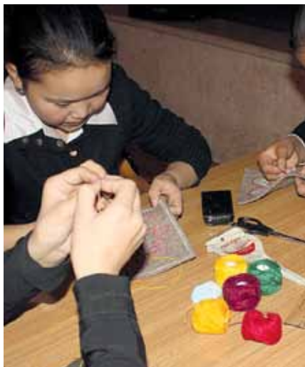
↑ Образовательная программа «Валяй, валяй!», КНМИИ им. Г. Айтиева, Кыргызстан.