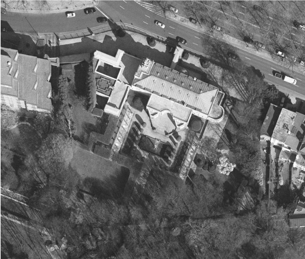
Aerial view of Stoclet House