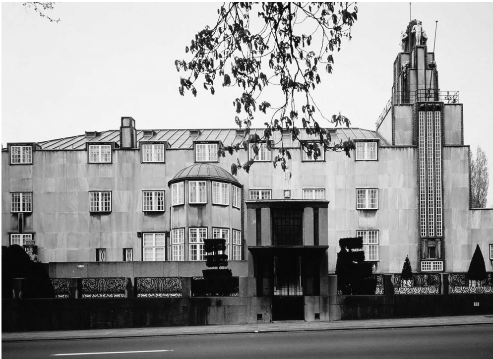
General view of the main façade