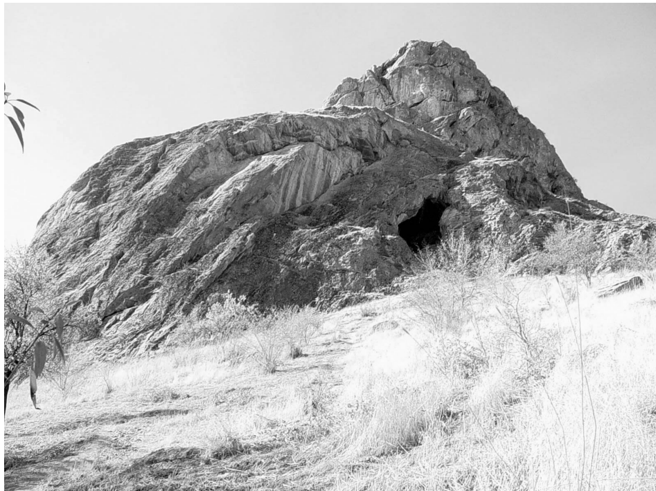
Site de l'âge de la pierre et de l'âge du bronze sur le troisième sommet