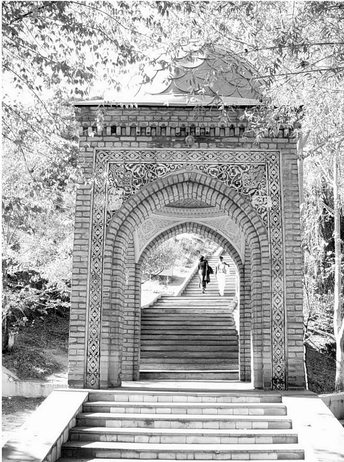
Gate at the starting point of the main pilgrim path