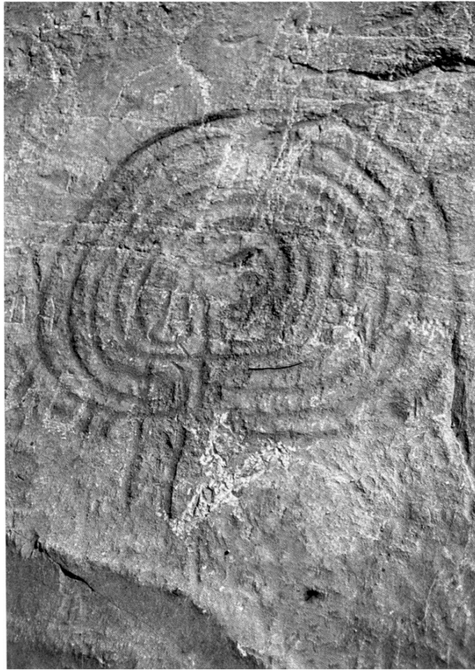
Petroglyph representing a labyrinth