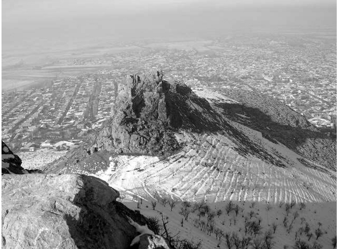
General view of the Sulaiman-Too Mountain