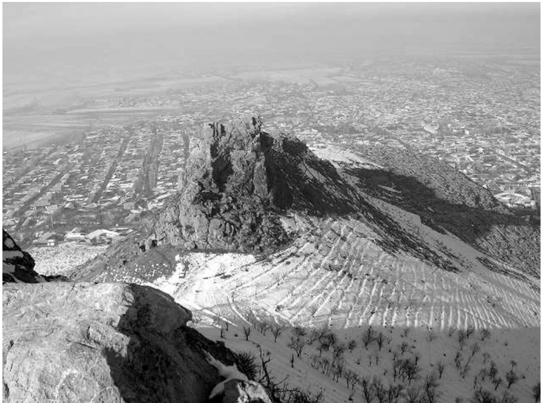
Vue générale de la montagne Sulaiman-Too