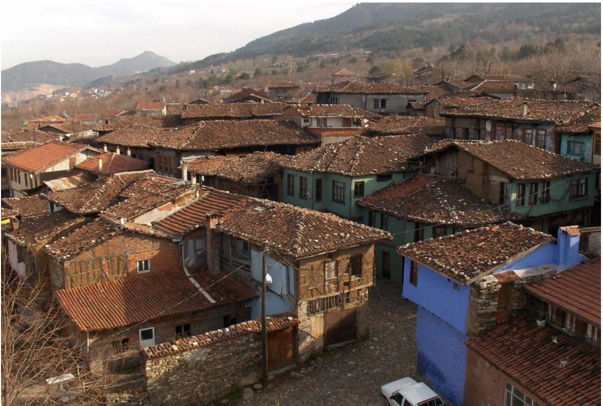
Village de Cumalıkızık