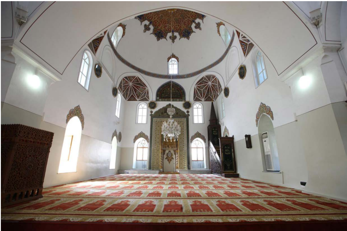
Mosquée d'Orhan Ghazi