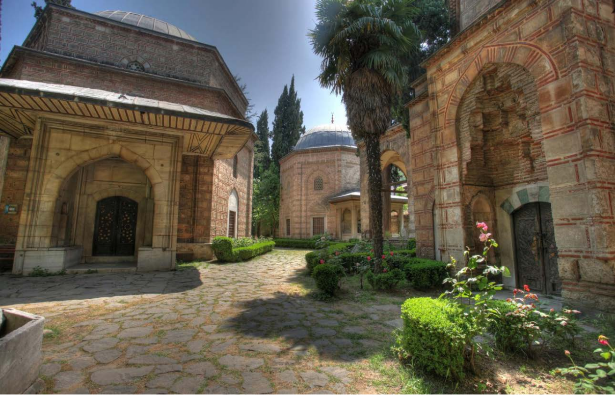
Muradiye (Murad II) Complex