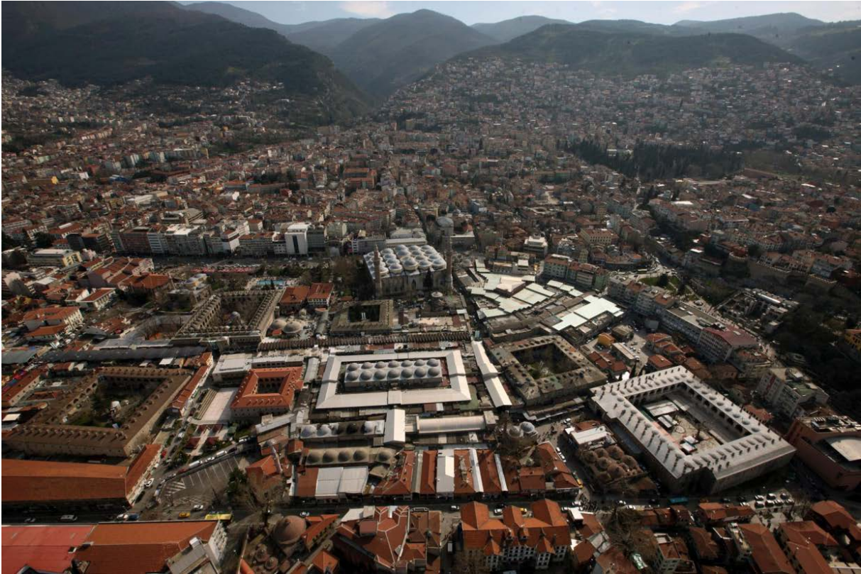
Kulliye d'Orhan Ghazi et ses environs