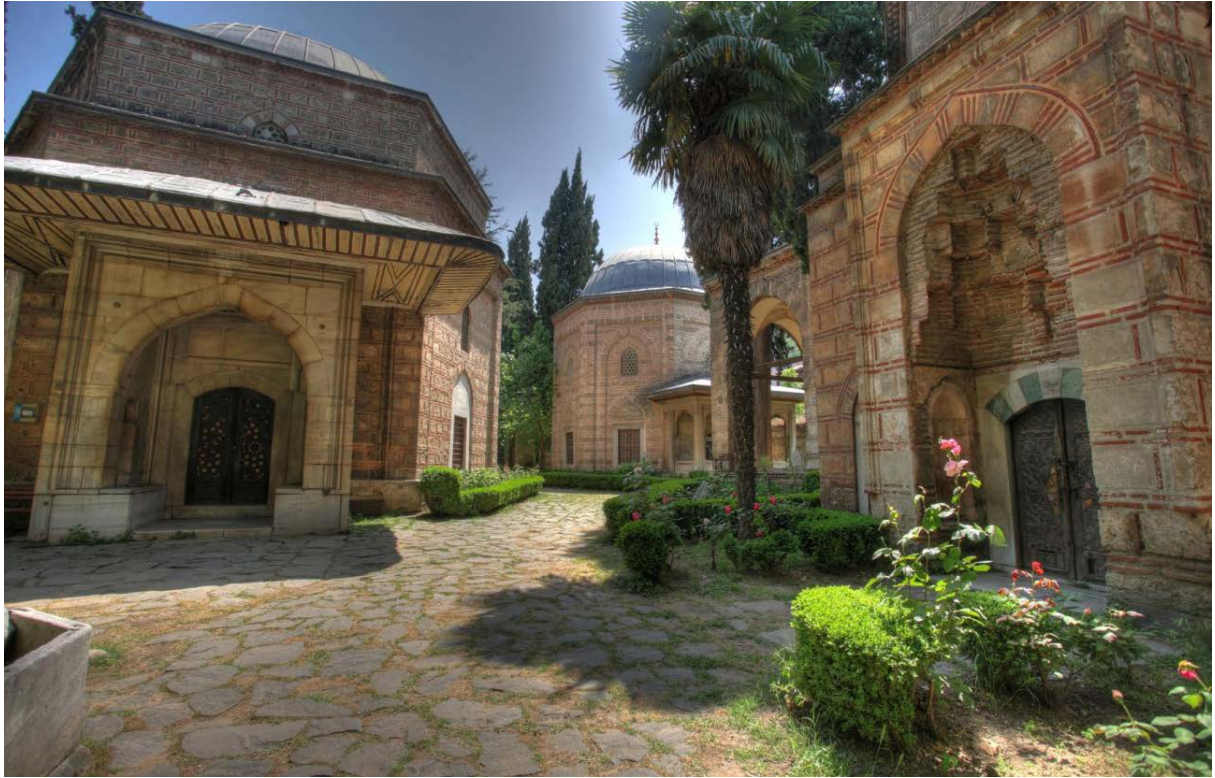
Ensemble de Muradiye (Murad II)