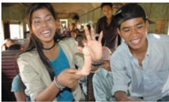
Yendo directo al grano (Phare Ponleu Selpak, Camboya)