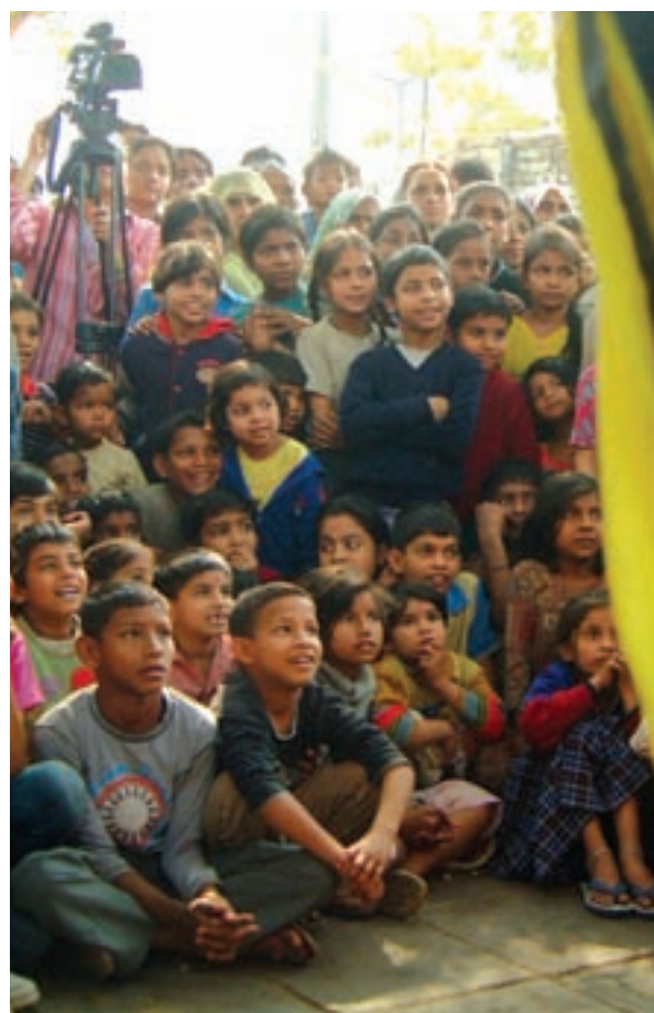
© The Ishara Puppet Theatre Trust

El proyecto busca desarrollar nuevas alianzas y ya ha respondido a varias solicitudes. Actualmente