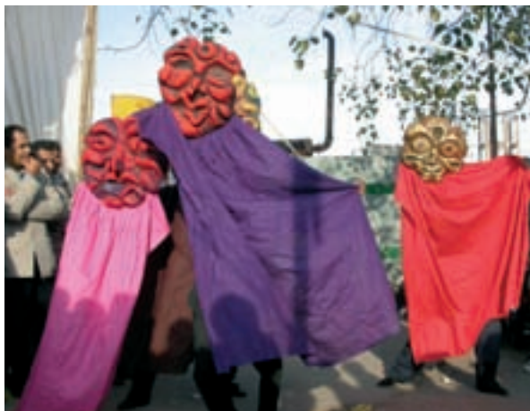
© The Ishara Puppet Theatre Trust

La primera obra con títeres que realizaron los jóvenes fue «Chunouti» (el desafío). La obra representa al VIH como una batalla entre el conocimiento y la ignorancia. La fuerza del conocimiento contrarresta la fuerza de la ignorancia, difundiendo la concientización acerca de cuatro temas principales: el uso adecuado del condón, la transfusión