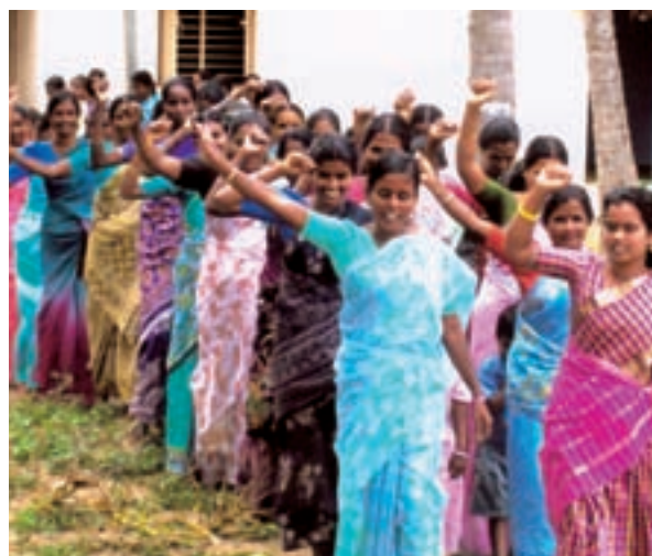
© TT Ranganathan Clinical Research Foundation

Otro asunto a largo plazo sería promover la responsabilidad de los hombres, demostrándoles cómo sus comportamientos pueden tener un impacto positivo en las mujeres, para que ellas puedan elegir por sí mismas. Tal objetivo está relacionado con un proceso de transformación social y cultural que es largo y difícil y que representa uno de los desafíos centrales cuando se trata de abordar el VIH y el SIDA, así como la vulnerabilidad de las mujeres, especialmente en las áreas rurales.