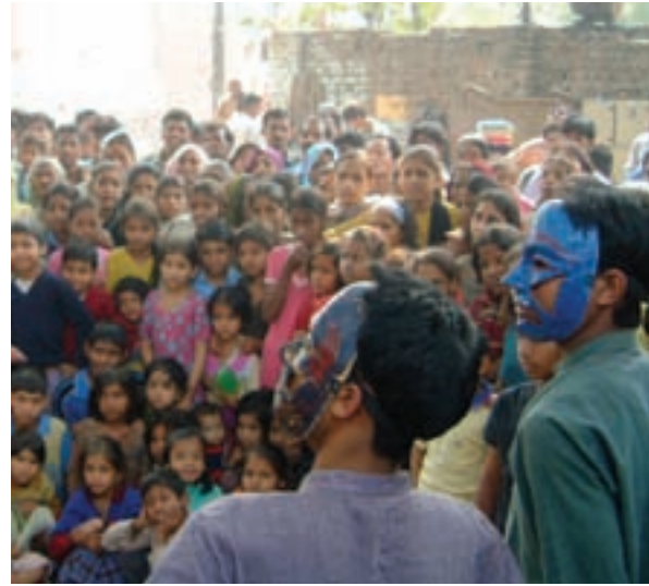
© The Ishara Puppet Theatre Trust