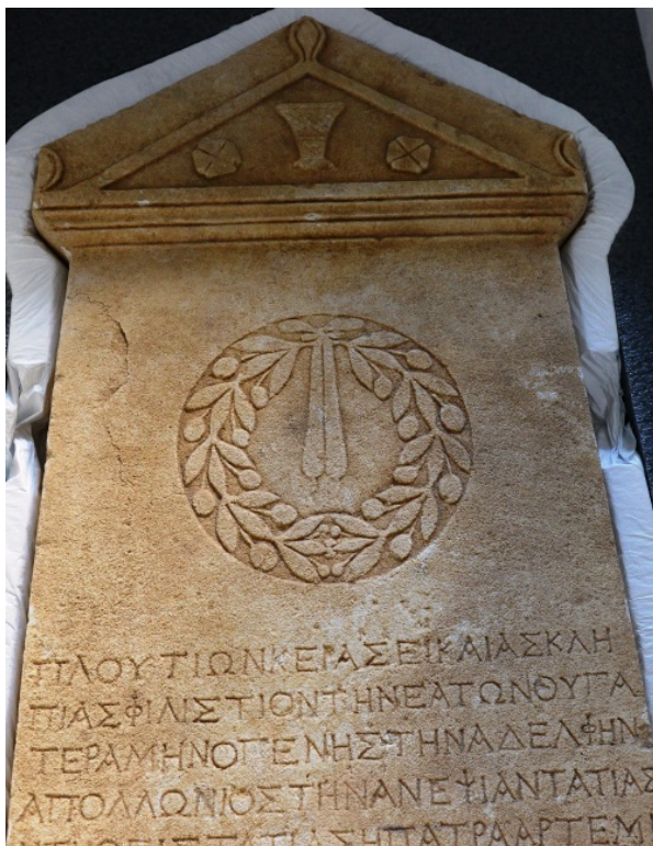
© Министерство культуры и туризма Турции

В 2006 г. эксперты министерства культуры и туризма Турции выявили 16 римских погребальных стел в цифровом каталоге одной из американских галерей. Научные исследования и изучение данных уголовных расследований, связанных с незаконными раскопками, проведение которых было обнаружено в месте происхождения стел, позволили сделать вывод, что последние были похищены в Западной Анатолии. После регистрации этих стел в базе данных Интерпола в качестве похищенных местное бюро ФБР в Нью-Йорке и подразделение по борьбе с уголовными преступлениями, связанными с предметами искусства, начали расследование и, в конечном счете, способствовали возвращению десяти погребальных стел в Турцию.