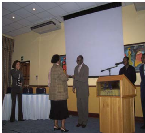
Lancement de la politique VIH et SIDA sur le lieu de travail à Maputo (Mozambique)

Lors de l'atelier, la version en langue portugaise de l'ouvrage HIV and AIDS Policy in the Work Place for the Education Sector in Southern Africa a été lancée. L'Organisation internationale du Travail (OIT), partenaire dans l'élaboration de cette politique, était représentée lors du lancement par le directeur de l'OIT chargé des pays de la Communauté de développement de l'Afrique australe (SADC).