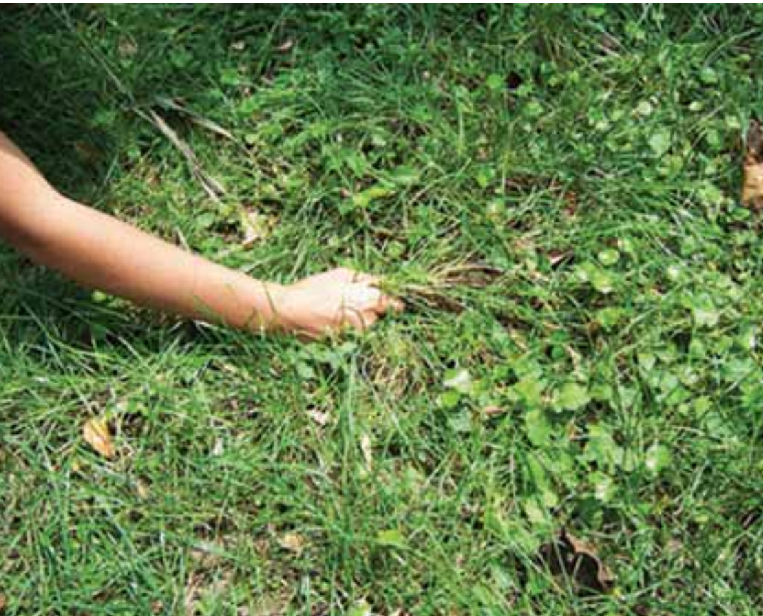
▲ Zhang Xueying China / Chine