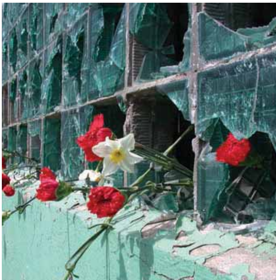
Костин Евгений Николаевич, 27 ▲ Russia / Fédération de Russie

Aujourd'hui, 130 millions de jeunes sont analphabètes. En 2000, 113 millions d'enfants en âge de fréquenter l'école primaire n'étaient pas scolarisés; ils risquent fort de constituer demain la nouvelle génération de jeunes analphabètes.