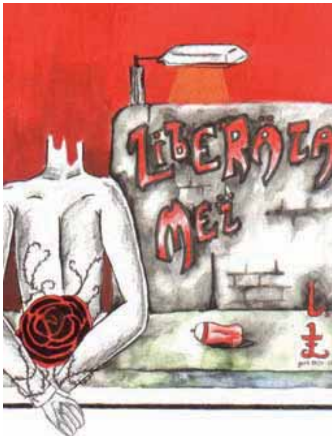
◀ Shoma Patnaik, 18 India / Inde

Quelque 209 millions de jeunes, 18% de la jeunesse mondiale, vivent avec moins d'un dollar par jour et 515 millions, près de la moitié de la jeunesse mondiale, vivent avec moins de 2 dollars par jour.