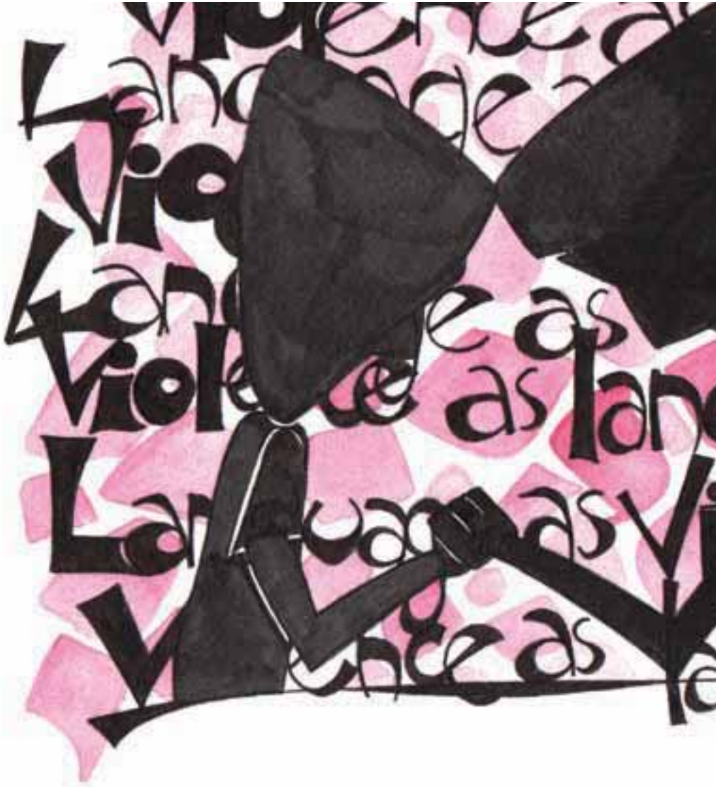
Yara Kassem, 25 Egypt / Egypte ▶