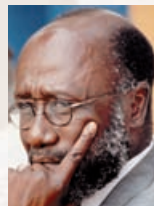
Boutros Boutros-Ghali Président du Conseil national des droits de l'Homme d'Egypte Vice-Président du Forum