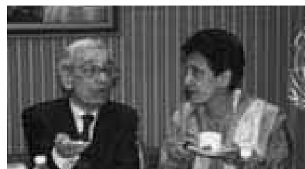
Бутрос Бутрос-Гали (Boutros Boutros-Ghali, слева) и Атти́я Инайятулла́х (Attiya Inayatullah).