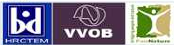
Các đối tác của dự án