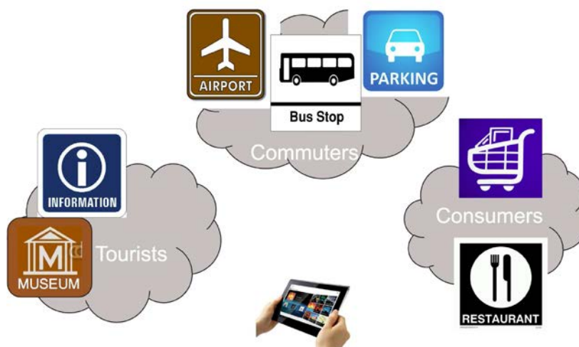
Рисунок 1 – варианты применения технологии D2D.

Технология D2D позволяет уменьшить время ожидания установления связи между абонентами беспроводной сети, увеличить скорость передачи данных и снизить энергопотребление.[2,3]