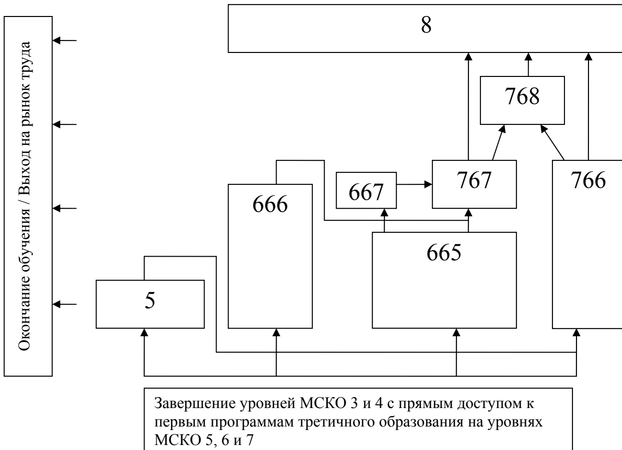
Схема 1. Пути перехода третичного образования в рамках МСКО

206. Категории программ третичного образования и пути перехода с одной программы на другую представлены в Схеме 1.